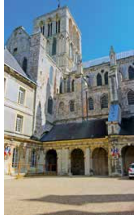
Das Rathaus wurde direkt an die Abtei La Trinité de Fécamp angebaut.