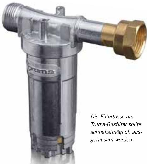
Die Filtertasse am Truma-Gasfilter sollte schnellstmöglich ausgetauscht werden.

Im Rahmen seiner Qualitätssicherung hat Truma einen Materialschaden an den Sichtfenstern der Filtertasse des Truma-Gasfilters festgestellt. Dies ist auf eine fehlerhafte Verarbeitung durch einen Vorlieferanten zurückzuführen. Der Materialschaden kann zur Folge haben, dass unkontrolliert Gas über den Flaschenkasten ins Freie entweicht. Weil es unter ungünstigen Umständen zu Gasverpuffungen und Verletzungen kommen könnte, hat sich Truma zu einer Rückrufaktion entschlossen. Immerhin: Es ist noch kein Fall von Gasverpuffungen bekannt geworden.