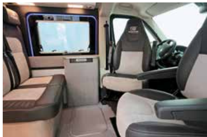
TECHNOFORM zeigte in Düsseldorf wie nobel sich das Interieur eines VW-Busses gestalten lässt.