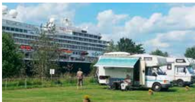
Auf dem Stellplatz am Nord-Ostseekanal ist der Blick auf die großen Schiffe gesichert.