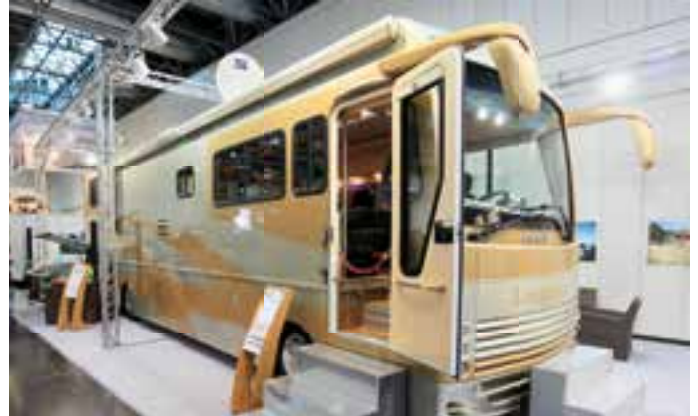
ALLES DRIN. Der noble Landsberg 1165 QB/SO ist komplett ausgestattet mit Wohnraumerker und Heckgarage. Auf dem Caravan-Salon war das Mobil für 330.900 Euro ausgestellt.