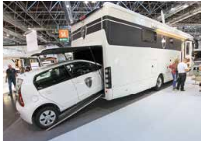
MIT HECKGARAGE. Der Morelo Palace Liner Style 107 GSO bietet im Heck eine Garage für einen Kleinwagen. Auf dem Salon wurde das Reisemobil für 410.530 Euro angeboten.

Der Trend geht besonders zu Fahrzeugen aus dem Premiumbereich. Insgesamt legen die Kunden immer mehr Wert auf hervorragende Qualität und haben zudem das Bedürfnis, umfassend und kompetent beraten zu werden.“ Zudem hätten die internationalen Kontakte zugenommen.