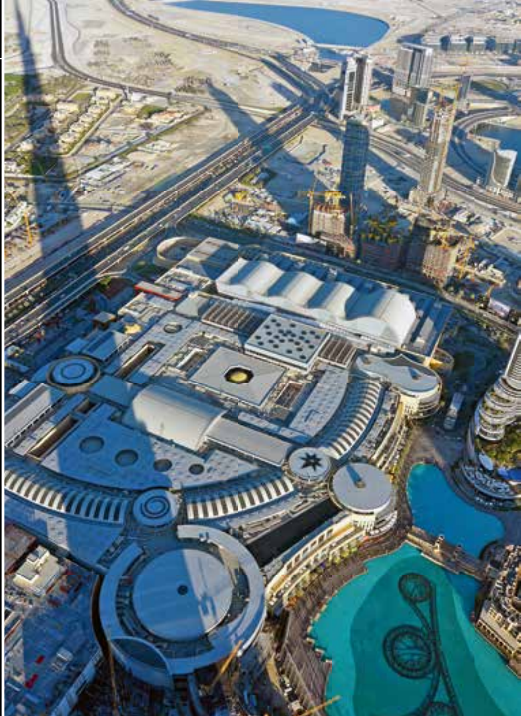
Die Dubai Mall im Schatten des Burj Khalifa.