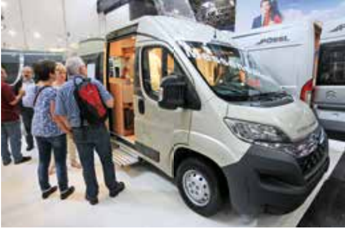
AUF CITROEN. Der neue Roadstar 600 L ist auf einem Citroen-Fahrgestell aufgebaut. Der Wohnbus wurde in Düsseldorf für 44.857 Euro angeboten.