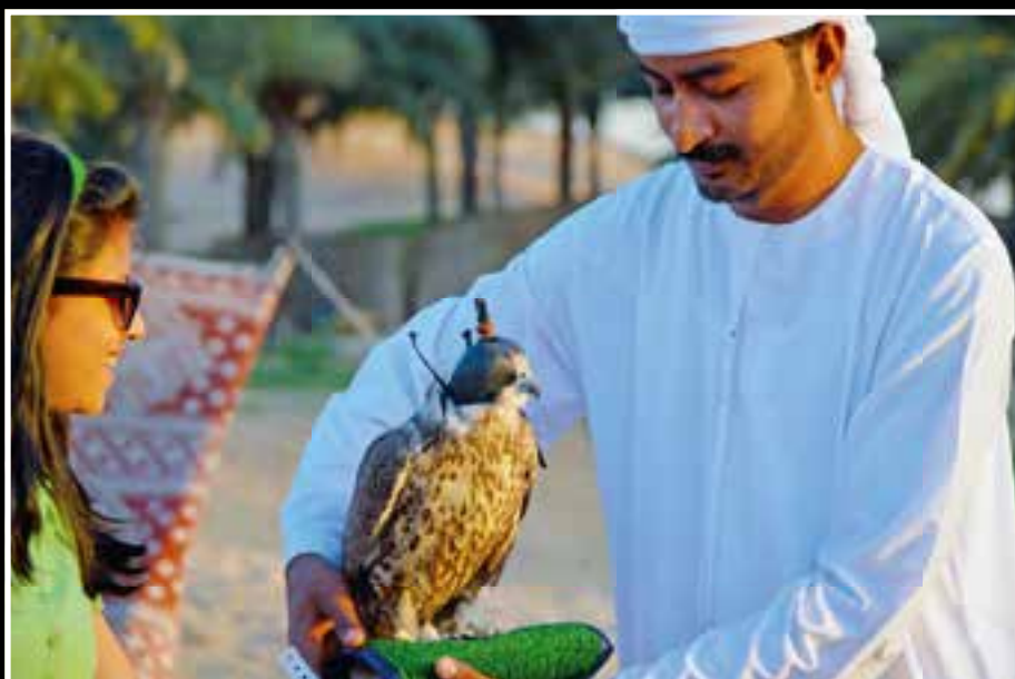
Die Falknerei hat einen hohen Stellenwert in Dubai.

der achtspurigen Autobahn ging vorbei an zahlreichen Autohändlern und an Bollywood, einem neuen Stadtteil mit großem Themenpark und riesigen Studios für die Filmindustrie..