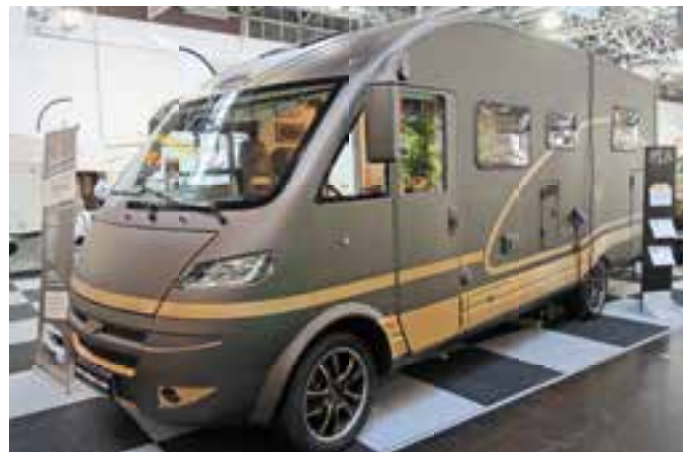
HINGUCKER. Der italienische Hersteller PLA zeigte auf dem Caravan Salon 2015 diesen ungewöhnlich gestalteten Integrierten. Der Preis: unter 60.000 Euro.