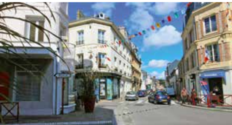
Die Innenstadt von Fécamp lädt zum Bummeln ein.