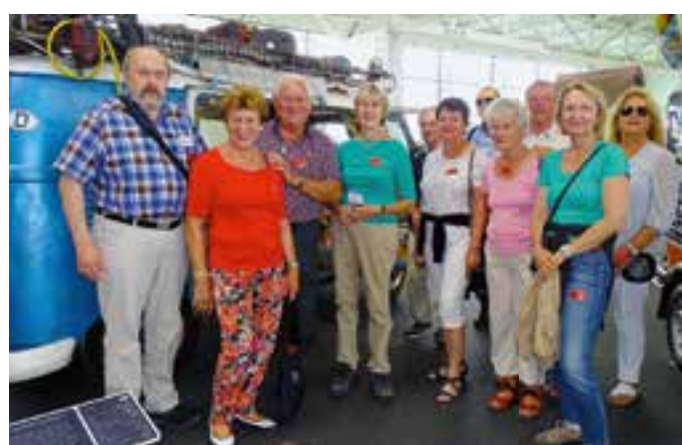
Ein Gruppenbild im Erwin Hymer Museum.

Abgerundet wurde das erste Operntreffen des EMHC durch ein buntes Rahmenprogramm, für das sich das engagierte Team des Gitzenweiler Hofes mächtig ins Zeug gelegt hatte. Der Campingpark bestätigte, dass er völlig zurecht zur Rie-