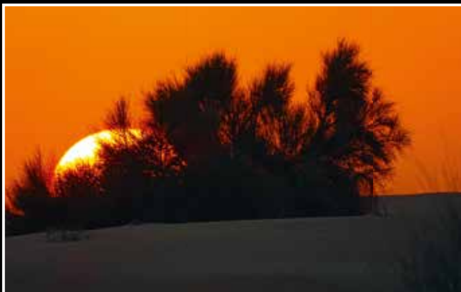
Phantastisch: der Sonnenuntergang in der Wüste.