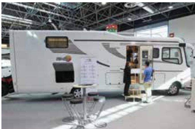
FÜR ANSPRUCHSVOLLE. RMB stellte in Düsseldorf den 924 QD Car vor, der im Heck Platz für einen Smart bietet. Das Ausstellungsstück kostete 254.562 Euro.