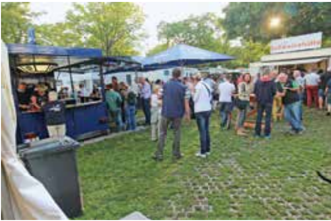
ENTSPANNUNG. Nach dem harten Messetag hatten sich die Salon-Besucher ein kühles Alt und deftige Speisen redlich verdient.