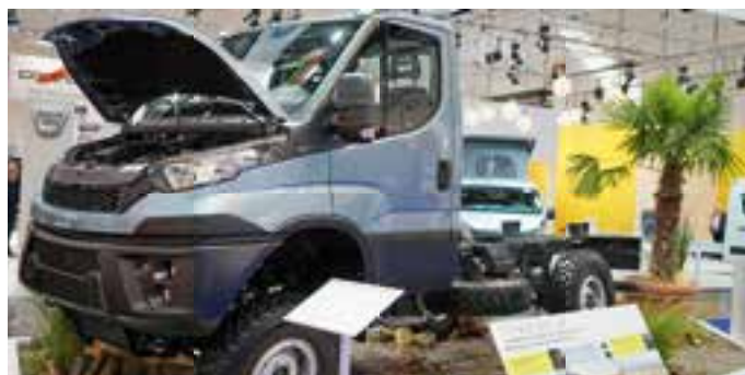
IVECO. Als kräftiger Geselle präsentierte sich das neue 4x4-Chassis des Iveco-Daily

ders erfreulich, weil der Caravan Salon als Trendbarometer für die kommende Saison gilt. Der Zuspruch beim Caravan Salon beweist, welchen großen Stellenwert das Caravanning als Urlaubsform in der Gesellschaft einnimmt“, erklärte Schäfer weiter. Auch die neue Halleneinteilung habe ebenso funktioniert wie die erfolgreiche Sonderschau „StarterWelt“. Auf dem messe-