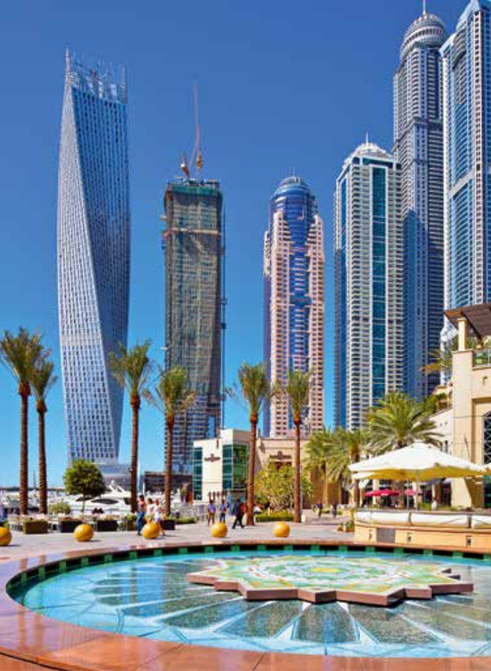
Die Hochhaus-Skyline an der Dubai Marina.