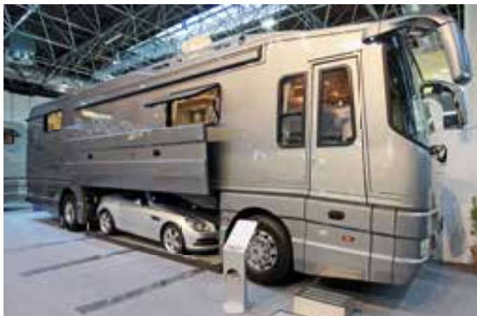
MIT SLIDE-OUT. Der Volkner Performance Compact mit Slide-Out lässt keine Wünsche offen. Das 10,50 Meter lange Reisemobil ist für 587.000 Euro zu haben.