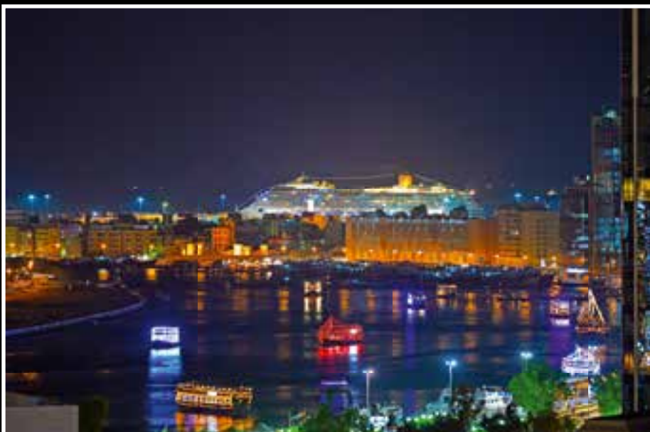
Auch große Kreuzfahrtschiffe machen in Dubai Station.

Am nächsten Morgen hieß es früh aufstehen, wir hatten den ersten Lift um 5,30 Uhr am Burj Khalifa zur Aussichtterrasse im 124. Stock gebucht, um den Sonnenaufgang zu beobachten. Beide Aussichtsplattformen haben übrigens Außen-