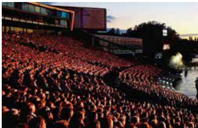
7000 Zuschauer auf der großen Festspiel-Tribüne in Bregenz.

Von unserem „Basislager“, dem Campingpark Gitzenweiler Hof bei Lindau ging die Fahrt – bei beginnendem Regen – nach Lindau. Dort nahm uns die Fähre nach Bregenz auf und im wahrsten Sinne des Wortes mit Blitz und Donner ging es über den aufgewühlten Bodensee. Die