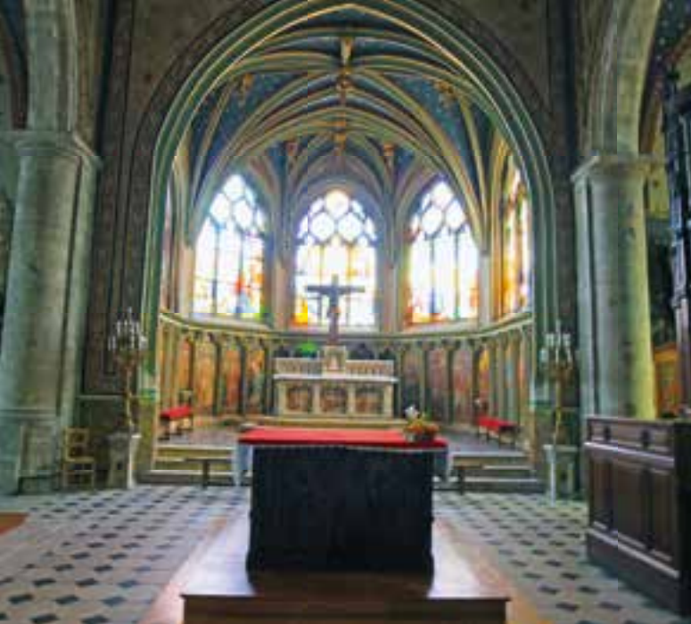
Sehenswert ist in Fécamp auch die Kirche Saint-Etienne aus dem 16. Jahrhundert.