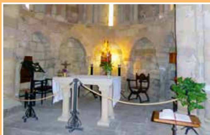
In der Kapelle Eunate.