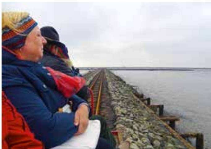
Unterwegs auf der Lorenbahn nach Nordstrandischmoor.

Der Tag verging mit seiner Fülle an neuen interessanten Eindrücken wie im Flug. Der Rücktransport klappte, wie nicht anders zu erwarten, bestens. Kaum im WomoLand wieder gelandet, ging es dort wieder in den „Kuhstall“ zum