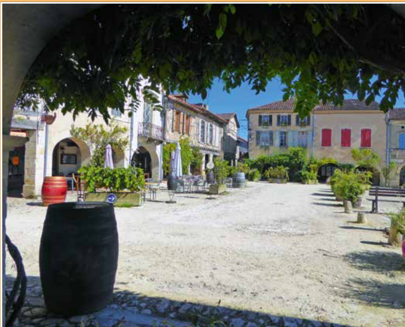
Das herrliche Zentrum von Labastide d'Armagnac.