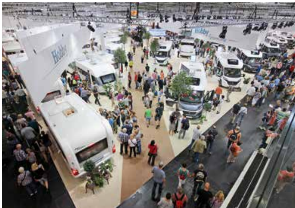
RIESENANDRANG. Das Publikumsinteresse auf dem Caravan-Salon war gigantisch. Die Aussteller freuten sich über den großen Andrang.