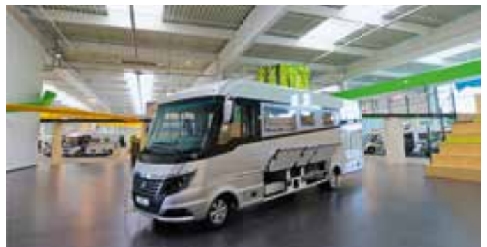
Auch die Oberklasse-Mobile von Niesmann + Bischoff gibt es in der Erwin Hymer World.