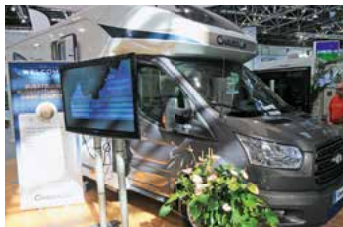
AUF FORD. Chausson präsentierte in Düsseldorf sein Modell 620 erstmals auf der Basis des neuen Ford Transit. Der Teilintegrierte mit dem Querbett im Heck wurde für 59.590 Euro angeboten.