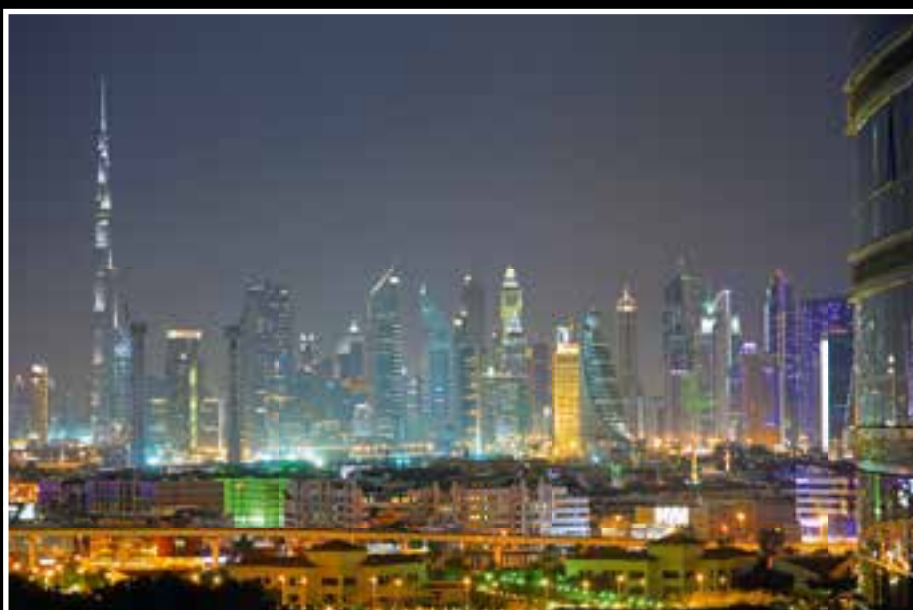
Zwei Millionen Menschen leben in Dubai.