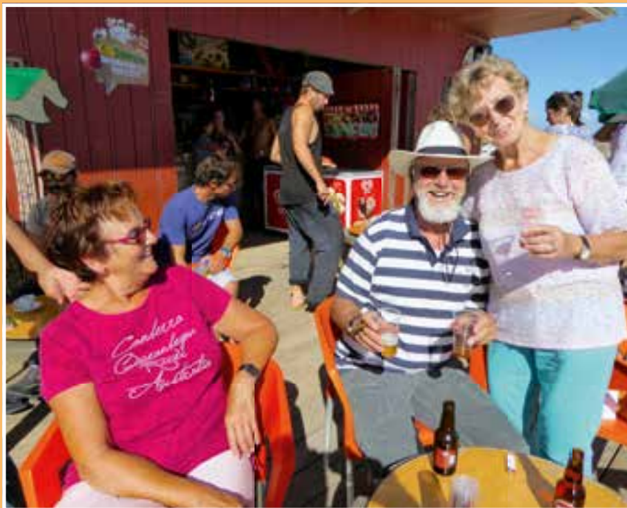
Warten auf den Sonnenuntergang.

Text und Bilder: Hanni Schneider-Stübing und Heinz Schneider