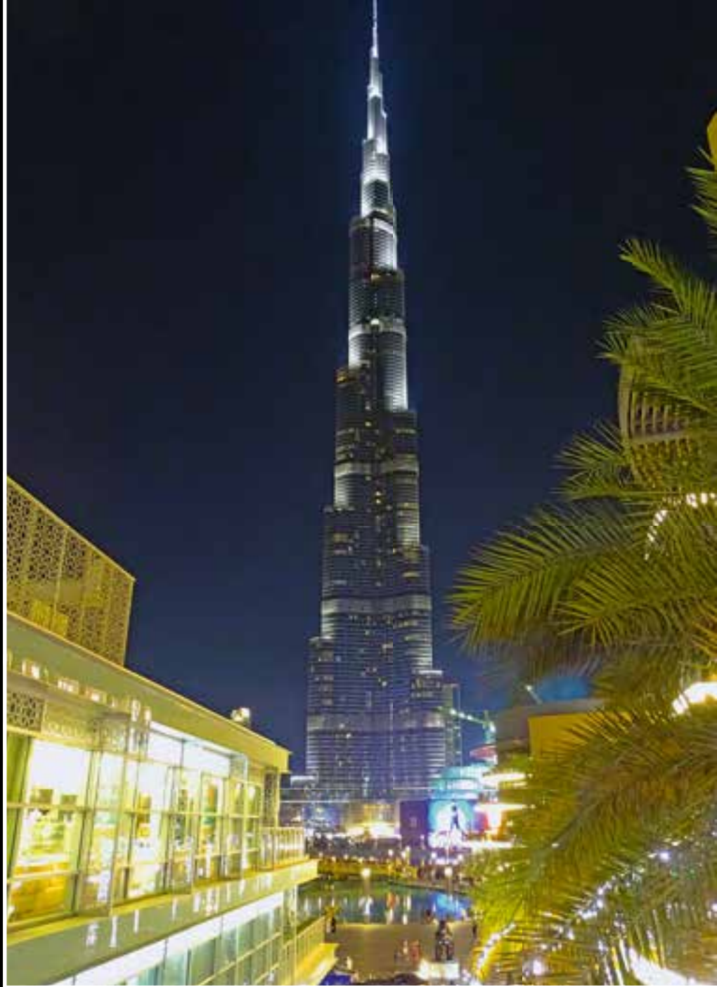
Das höchste Haus der Welt bei Nacht.

Die nächste Tour brachte uns zur Gartenstadt Al Ain. Die Fahrt ging durch eine