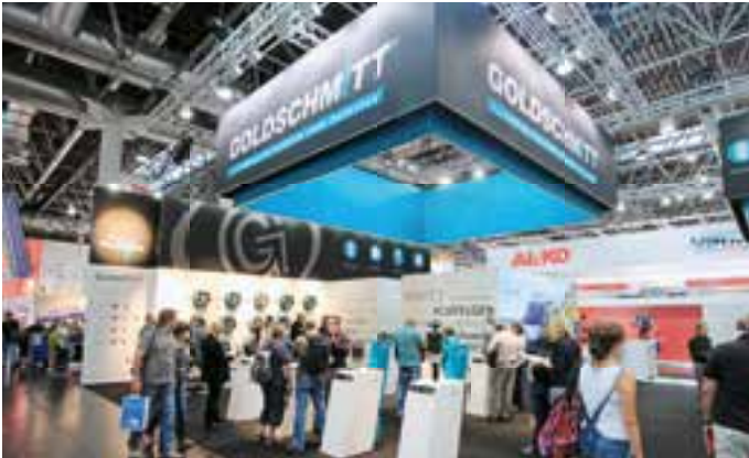
GEFRAGTES ZUBEHÖR. Auch in der Zubehörrhalle 13 herrschte reger Publikumsverkehr. Die Aussteller – hier Goldschmitt – waren höchst zufrieden.