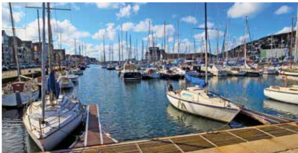
Der Reisemobilstellplatz wurde direkt am Yachthafen angelegt.

Die Geschichte von Fécamp geht zurück bis ins 7. Jahrhundert, als Waningus hier ein Frauenkloster gründete. Er ließ eine Kirche und ein Kloster errichten, wo der Legende nach das Meer einen Feigenbaumstamm anspülte, der wieder Wurzeln schlug. In einer Ritze des Baums wurde ein Gefäß gefunden, das einige Blutstropfen Jesu Christi enthalten soll. Angeblich hat