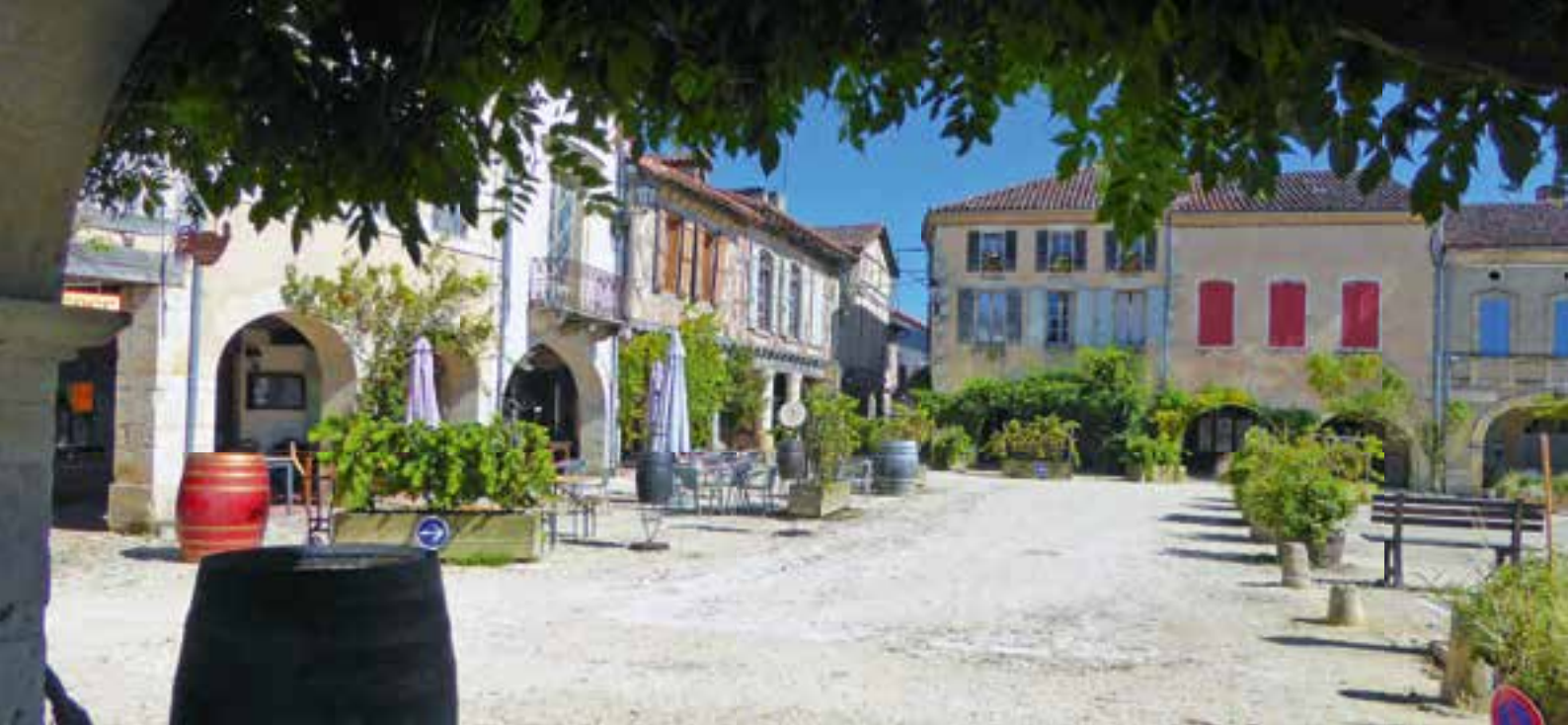
Das Zentrum von Labastide d'Armagnac ist ein feiner Zwischenstopp auf dem Weg nach Portugal.