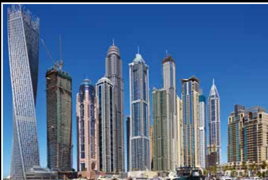
Die Dubai Marina an der Hafentfront.

abwechslungsreiche Wüstenlandschaft bis zu den Ausläufern des Hajar Gebirges. Hier besuchten wir die archäologischen Ausgrabungen aus dem 3. Jahrhundert vor Christus. In der Datteloase von Al Ain erfuhren wir etwas über das Bewässerungssystem „Falaj“, außerdem sahen wir, wie die Palmen erklommen werden, um die Datteln zu ernten. Auf der Rückfahrt besuchten wir den Kamelmarkt. Auf dem begrünten Wüsten-Highways ging es 120 Kilometer nach Abu Dhabi. Hier besuchten wir die drittgrößte Moschee der Welt, die „Shaikh Zayed Moschee“. Etwa 40.000 Gläubige sollen allein in die Gebetshalle der Großen Moschee passen. Die Säulen wurden mit Marmor und indischen Halbedelsteinen verziert, in die Wände des Gebetsraumes sind Koran-Zitate in großen, beleuchteten Buchstaben eingraviert. Die Kuppel des Hauptdomes ist 85 Meter hoch, darin hängt mit 10x15 Meter der größte Kronleuchter der Welt – von Swarovski gefertigt. Am Boden liegt der größte handgearbeitete Perserteppich: 5000 Quadratmeter groß und 47 Tonnen schwer. Die vier Minarette ragen 104 Meter in den Himmel, insgesamt 82 Kuppeln zieren das Bauwerk.