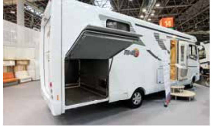
RMB. Dieses Mobil mit riesiger Heckklappe zeigte RMB auf dem Caravan Salon 2015 in Düsseldorf.