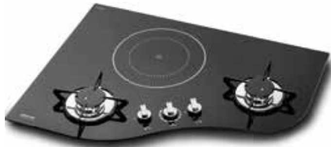
Kochen mit Gas und Strom gleichzeitig – Thetford macht es möglich.

Induktion und Gas können auch zur gleichen Zeit verwendet werden, falls ein