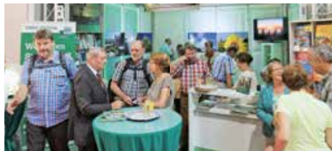
Der Stand des EMHC auf dem Caravan-Salon war viel besucht. Engagiert und freundlich begegnete das Standteam den zahlreichen Gästen

Zu den Messeaktivitäten des EMHC in Düsseldorf gehörten