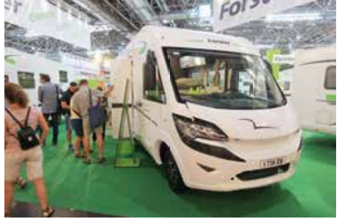
GÜNSTIG: Forster präsentierte auf dem Caravan-Salon 2015 mit dem I 738 IB einen schicken Integrierten, der weniger als 59.000 Euro kostet.