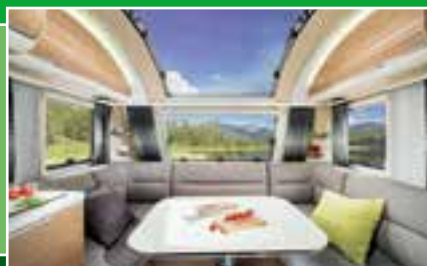
Polyplastic ermöglicht Lichtspiele im Mobil