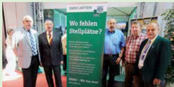
Große Resonanz erfährt der Euro Motorhome Club (EMHC) auf seine Aktion „Wo fehlen Stellplätze?“. Der Club-Vorstand startete die Aktion auf dem Caravan-Salon in Düsseldorf.