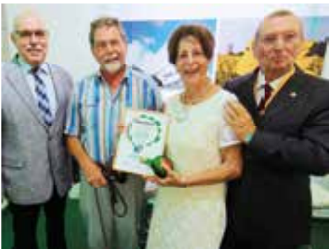
Der EMHC ehrte treue Mitglieder. S. 7