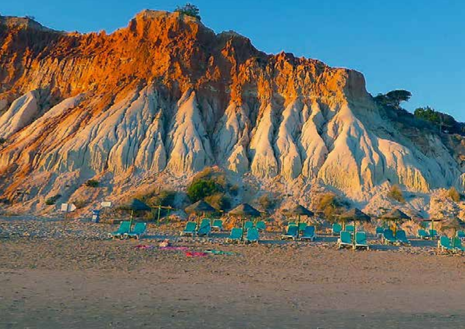
Der Strand in der Abendsonne.

fahrschule gegründet haben. Über Nebenstraßen der Westalgarve gelangten wir nach Messejana-Aljustrel, dieser Stell-