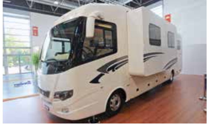
KLEINER SCHWEIZER: 9,50 Meter lang ist der Starliner 32 sm von Maurer. 357.868 Euro berechnet der Schweizer Hersteller für den kompakten Integrierten.