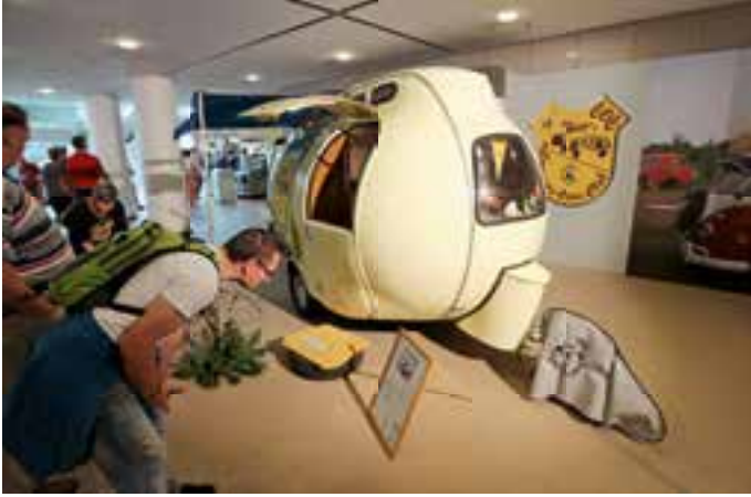
WOHNEI: Dieser skurile Wohnwagen aus den sechziger Jahren wurde auf dem Salon sehr bestaunt.