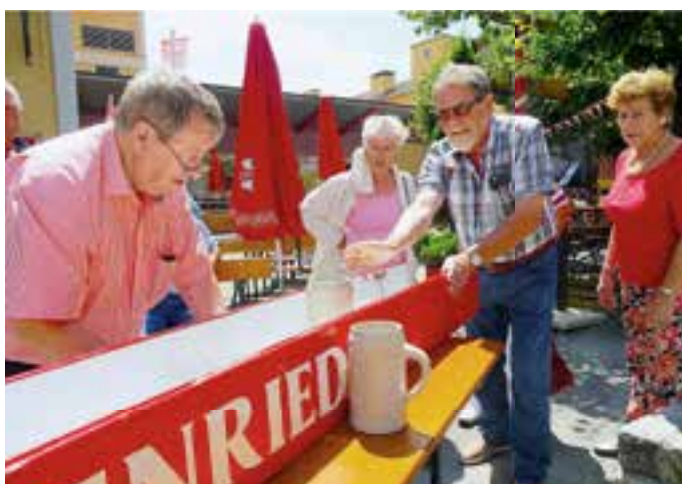
In Bad Schussenried hatte man Spaß beim Bierkrugschieben.

Rüdiger Zipper Fotos: Friedhelm Biell, Bregenger Festspiele