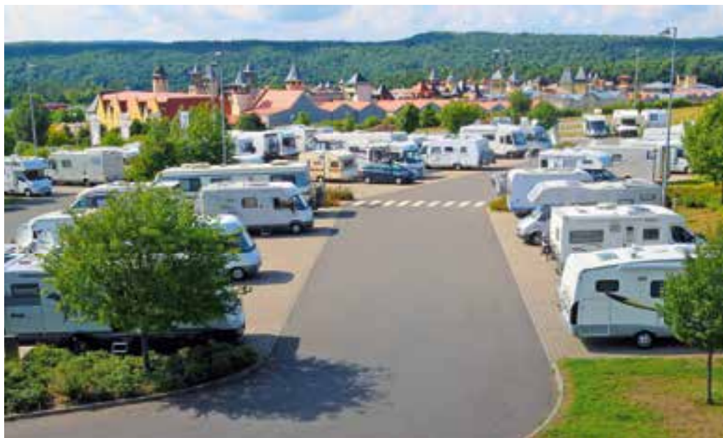
Direkt an die Erwin Hymer World schließt sich das Outletcenter Wertheim Village an.

Ein lohnendes Ziel ist die Erwin Hymer World auch wegen der attraktiven Nachbarn: Nur wenige Meter sind es zum