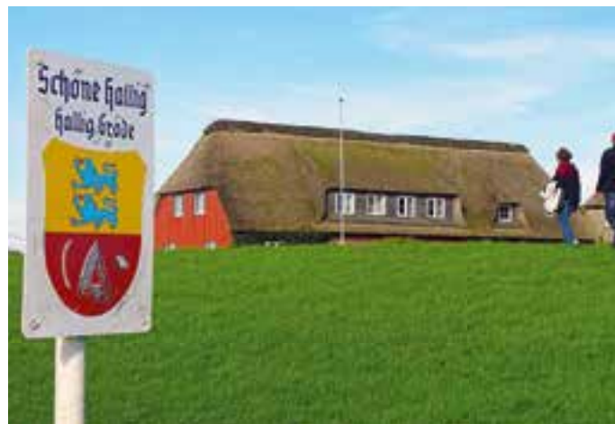
Auch eine Hallig hat ein Ortsschild.