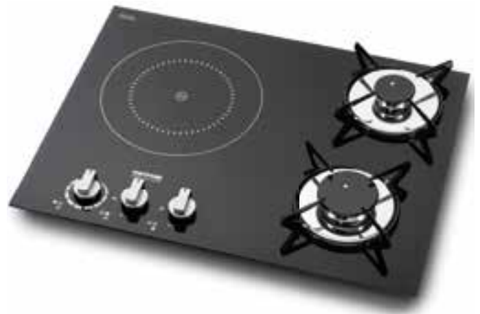
Das Modell Topline 981 Hybrid von Thetford passt gut zu edlen Reisemobilen.

Das Design des Kochfeldes wird von der Form des Glases und der Positionierung der Kochtöpfe bestimmt. Beide Formen bieten ein kompaktes, doch ergonomisches und praktisches Layout. Die Geräte werden mit einer Garantie von drei Jahren geliefert.