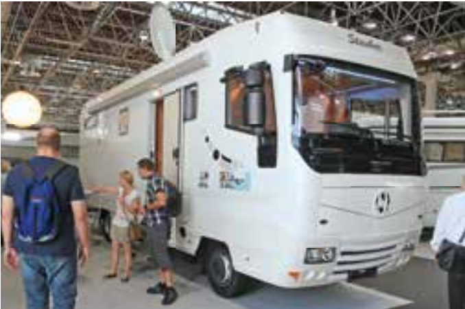
UNIKAT. Wer mit einem Stauber Actross-Liner vorfährt, dem ist Aufmerksamkeit gewiss. Das Mobil wird in unterschiedlichen Breiten angeboten. Der Basispreis liegt bei 159.900 Euro.