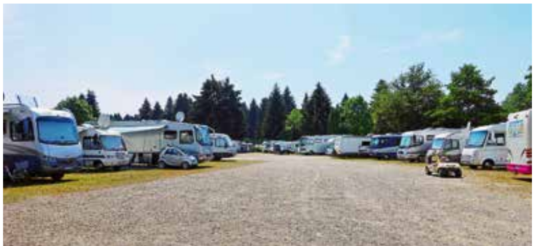
Auf dem Gitzenweiler Hof in Lindau-Oberreitnau fühlten sich die EMHC-Reisenden wohl.

Nach den ersten Takten der immer wieder faszinierenden Musik des großen italienischen Meisters und den ersten gesungenen Tönen hatte