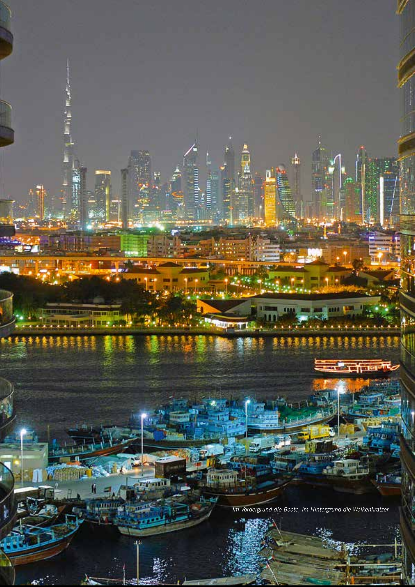
Im Vordergrund die Boote, im Hintergrund die Wolkenkratzer.