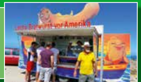
Mal eben im Mobil bis ans Ende Europas