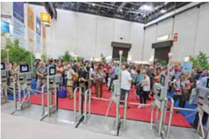
ANSTURM. Schon morgens bildeten sich lange Schlangen vor den Drehkreuzen. Mehr als 200.000 Besucher wurden 2015 auf dem Caravan-Salon gezählt – so viele wie noch nie zuvor.