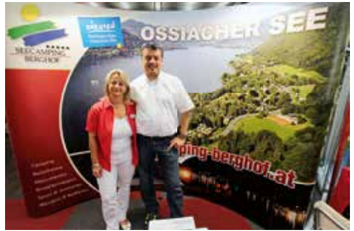
Die Betreiber des Seecampings Berghof in Kärnten freuten sich über das große Publikumsinteresse in Düsseldorf.