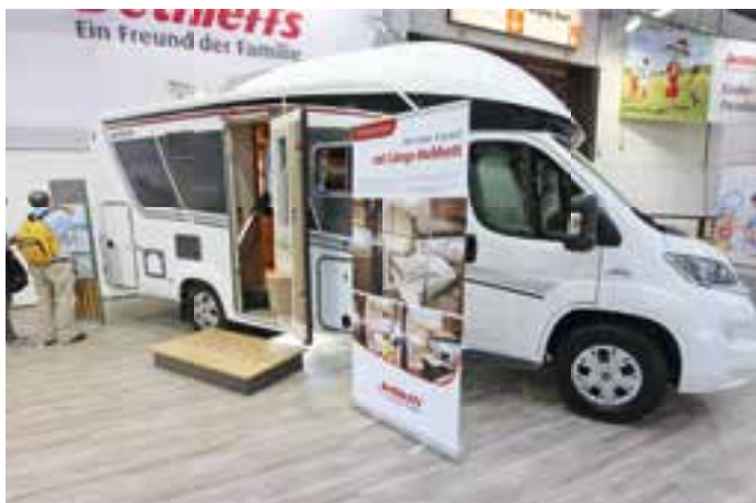
DETHLEFFS. Der Hersteller aus dem schwäbischen Allgäu stellte auf den Caravan Salon den neuen 4-travel mit einem Längs-Hubbett vor.