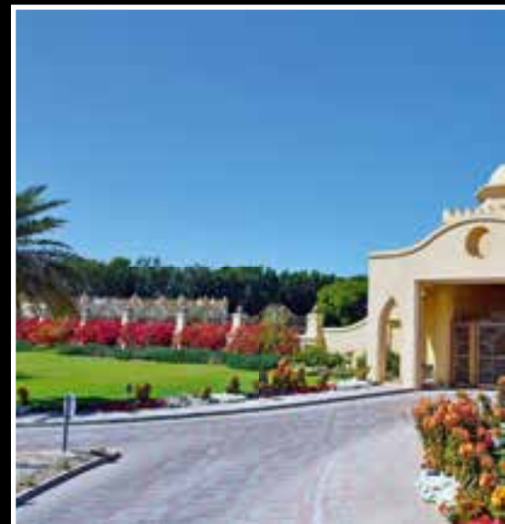
Solche Residenzen gibt es zuhauf in Dubai.