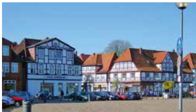
Die Altstadt von Rendsburg lädt zum Bummeln ein.

Um 8.30 Uhr startet das Kanal-frühstück mit rustikalem Früh-stücksbuffet.