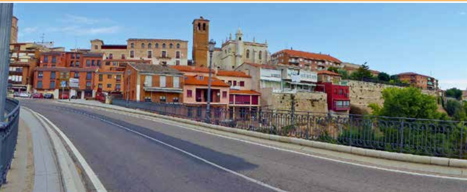
Tordesillas und Duero.

Die Steilküste ist hier ca. 30 Meter hoch, über Holztreppen gelangt man an den Strand. An diesem Abend war das Licht besonders schön, der Strand und die Steilküste erstrahlten in einem besonderen Charme. Den nächsten Tag war Ruhe angesagt.