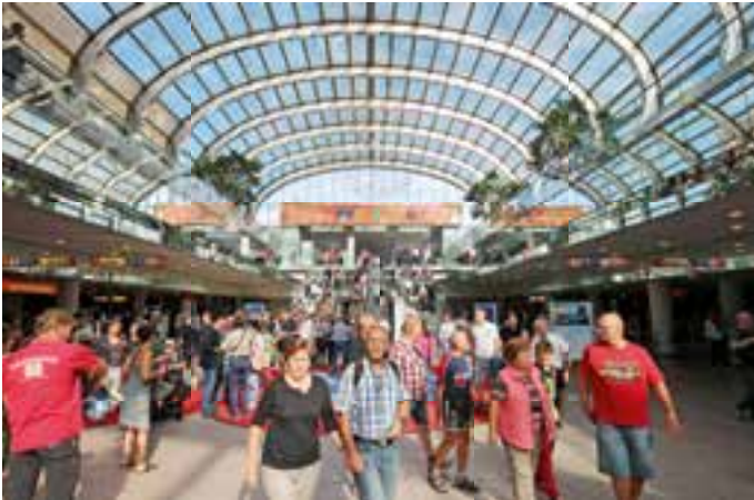
ENTREE: Wie hier am Eingang Nord betraten die Besucher gut gelaunt die Düsseldorfer Messehallen.