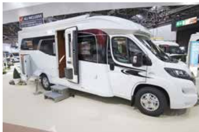
HOBBY. Der Optima de Luxe T 75 HGE war einer der großen Hingucker des Herstellers aus Fockbek.