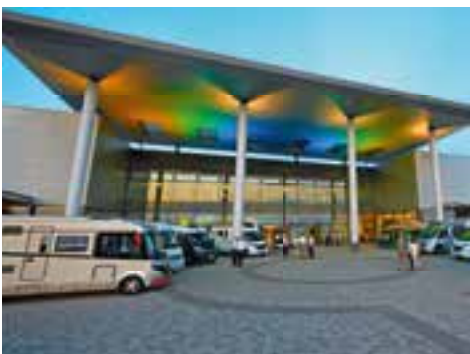
Die neue Erwin Hymer World. S. 30