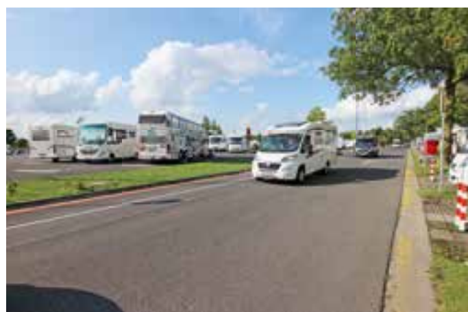
BELIEBT. Aus ganz Europa reisten die Salon-Besucher mit ihren Mobilien und Caravans nach Düsseldorf. Die Stimmung im Caravan-center war ausgezeichnet.