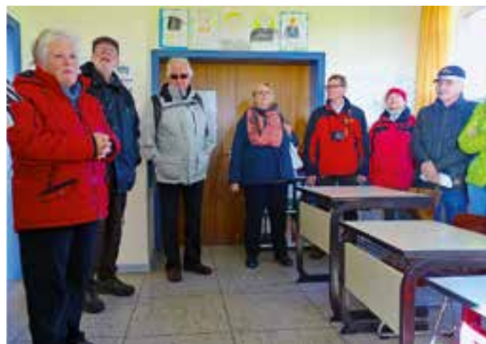
Auf Nordstrandischmoor drücken vier Kinder die Schulbank.