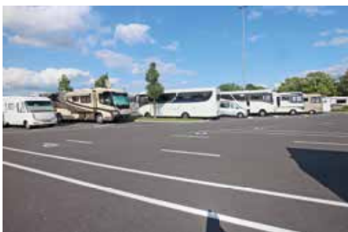
CARAVANCENTER. 70.000 Übernachtungen wurden auf dem schönsten Stellplatz auf Zeit während des Caravan Salons registriert – ein Rekord.