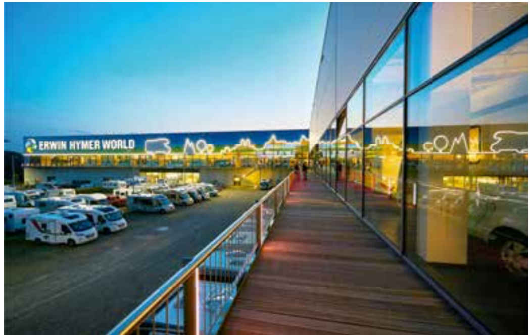
Rund 500 Freizeitfahrzeuge sind ständig in der Erwin Hymer World zu haben.

In der Caravaning-Erlebniswelt der Erwin Hymer World werden ganzjährig rund 500 der aktuellsten Modelle – vom Einsteigerfahrzeug bis hin zum Caravan oder Reisemobil der Luxusklasse ausgestellt. Dabei erwarten den Besucher Fahrzeuge aller Marken der Erwin Hymer Group: Bürstner, Carado, Dethleffs, Hymer, Laika, LMC, Niesmann+Bischoff, Sunlight und 3DOG camping. Außerdem wird eine große