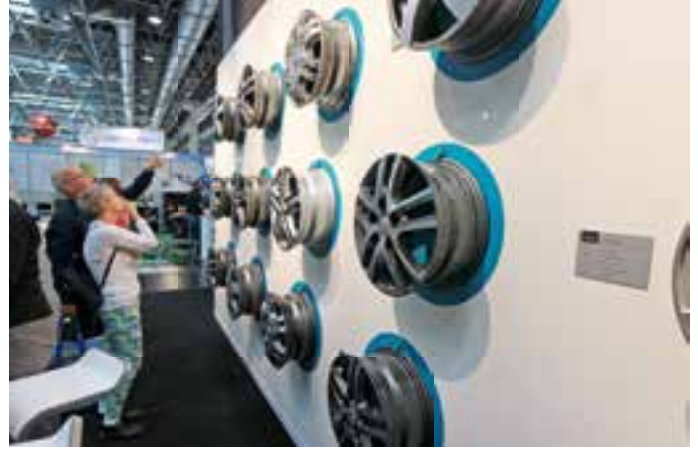
SCHICKE BEINE. Welche Felgen passen am besten zum Reisemobil? Am Goldschmitt-Stand fiel die Entscheidung nicht leicht.