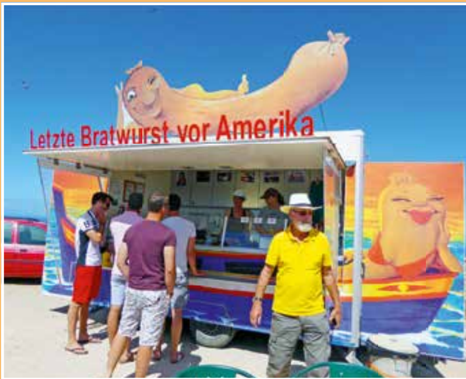
Die „Letzte Bratwurst vor Amerika“ am westlichsten Punkt Europas.

tur reichen von der Hochgotik über den manuelinischen Stil bis hin zur Renaissance. Nebenan gibt eine Kapelle ohne Dach, sie wurde nicht fertig gestellt, da der Regent starb und sein Nachfolger Anderes im Sinn hatte.