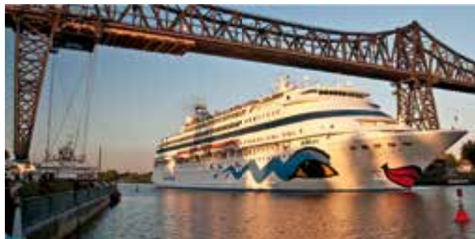
Die Hochbrücke mit der Schwebefähre ist in Rendsburg ein spektakuläres Motiv. Die Teilnehmer der Grünkohlfahrt werden hier übersetzen.

Am Samstag, 5. März 2016, stehen ab 8 Uhr wieder die Brötchen zum Frühstück be-reit. Um 10 Uhr ist Abfahrt nach Rendsburg zur Whisky-Galerie Krüger. Dort gibt es eine Führung durch die Gale-rie mit Erklärung der Herstel-lung des „Lebenswassers“ und dem Tasting einiger Sorten. Von 12 bis 14 Uhr kann die Zeit zum Bummeln in der Rendsburger Innenstadt ge-nutzt werden. Anschließend geht es mit dem Bus zum Fuß-gängertunnel mit anschlie-ßender Tunnelbegehung. Um 14.30 Uhr erfolgt die Rück-fahrt von Rendsburg Süd zum Reisemobilstellplatz NOK. Um 18 Uhr wird das Grünkohlbuf-fet aufgebaut. Dazu gibt es ei-nen Korn (weitere Getränke als Selbstzahler). Der lockere Ausklang erfolgt mit einem historischen Film über den