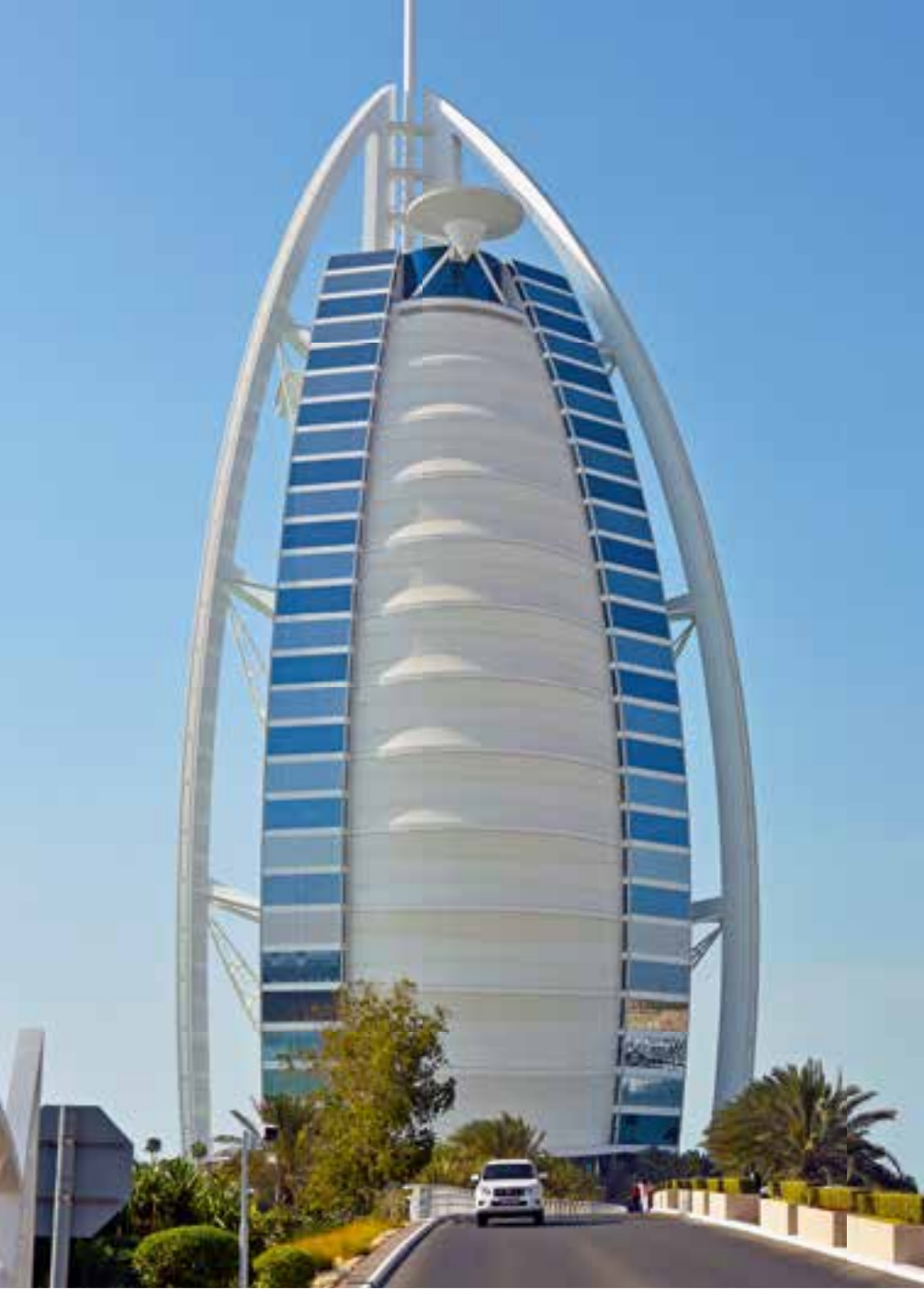
Die Zufahrt zum 7-Sterne-Hotel

Überragt wird das Ganze vom Burj Khalifa, dem höchsten Gebäude der Erde mit einer Höhe von 828 Meter und 189 Stockwerken. Hier findet man das höchstgelegene nutzbare Stockwerk, weltweit. Rund 200 große und 650 kleine Betonpfähle wurden für den Bau des Burj Khalifa in den Boden getrieben, die bis in eine Tiefe von etwa 70 Metern unter dem Meeresspiegel reichen. Für den Bau waren insgesamt 330.000 Kubikmeter Beton sowie viel Stahl und andere Materialien nötig. Wegen der großen Höhe beträgt die Auslenkung des Turms in den höchsten Stockwerken bei Wind rund 1,5 Meter. Die Bauarbeiten begannen 2004, 2009 wurde die Endhöhe von 828 Metern erreicht. Das Gebäude wurde am 4. Januar 2010 eingeweiht. Der Turm hat eine breite Mischung verschiedener Funktionen wie Handel, Wohnen, Büros, Hotels, Einkaufen, Unterhaltung und Freizeit. Zwei Doppeldeckaufzüge führen exklusiv zur Aussichtsplattform in der 124. Etage in 452 Metern Höhe. In einer Minute hat man diese Höhe mit dem Schnellaufzug erreicht. Hier gibt es eine Aussichtsplattform mit Außenterrasse und einem Souvenirshop „At the Top“. Von hier oben hatte man eine fantastische Aussicht auf die Dubai Mall, den Khalifa Lake mit die Dubai Fountain und den Arabischen Golf. Mit der Dubai Fountain entstand in Downtown Dubai vor dem Burj Khalifa das größte Wasserspiel der Welt.