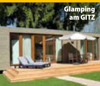
Glamping am GITZ