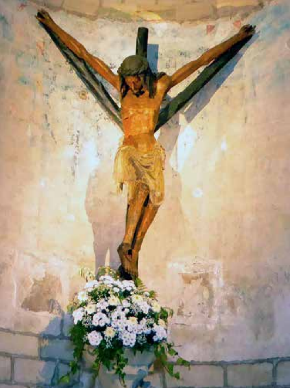
Beeindruckend: das Kruzifix in Y-Form.