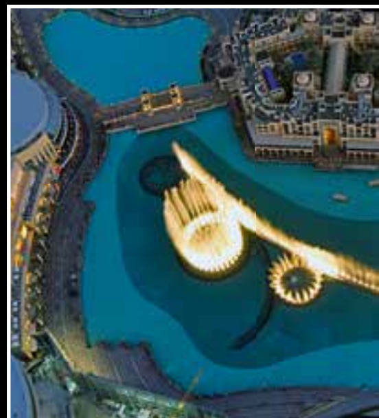
So sehen Wasserspiele aus 452 Metern Höhe aus.