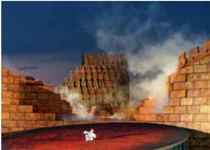
Gigantisch: Das Bühnenspektakel auf der Seebühne in Bregenz.