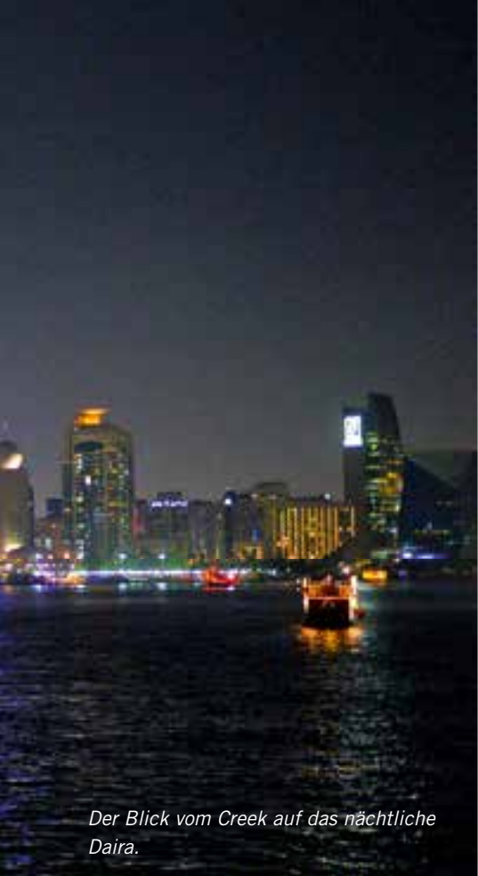
Der Blick vom Creek auf das nächtliche Daira.

bereiche und man kann durch durchbrochene Glasscheiben fantastisch fotografieren. Den Übergang von der Nacht, mit all seinen Lichtern und dem aufkommenden Tageslicht, ist ein in Erinnerung bleibendes Erlebnis. Ich glaube, wir haben hier an die 300 Fotos gemacht... Anschließend ging es zurück zum Hotel, wo wir frühstückten und dann den Bereich Deira/Creek erkundeten.