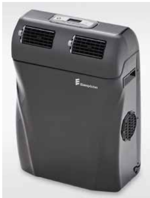
Das neue Klimagerät Ebercool Portable sorgt im Reisemobil für ein angenehm frisches, gut verträgliches Klima.

Die Ebercool Portable wird von der Eberspächer Heizung Vertriebs-GmbH & Co. KG in Torgelow vertrieben.