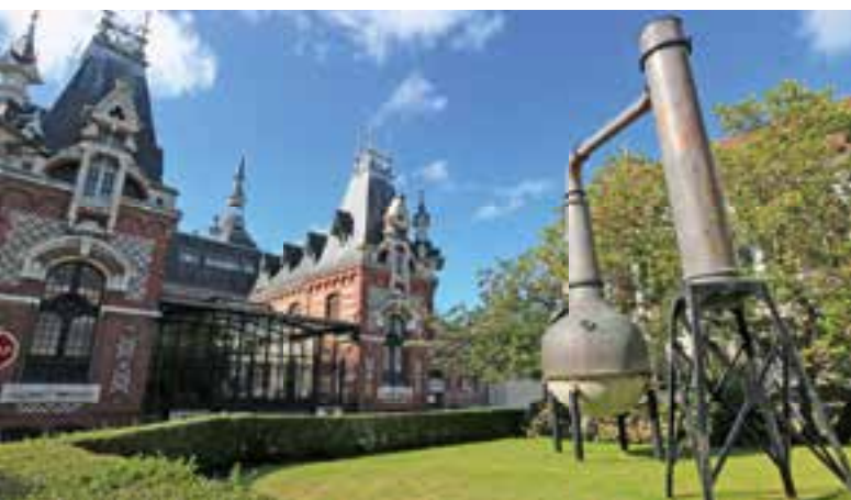
Die riesige Brennblase wurde neben dem Palais Bénédicte aufgestellt.

die Engländer im Hafen wären. Die Folge war, dass der Hafen beschossen wurde. Zwei Zerstörer der Briten konnten stark beschädigt entkommen.