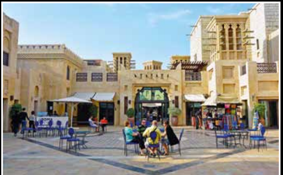
Die Windtürme erinnern an das historische Dubai.