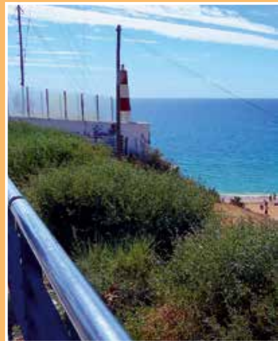
Am Strand von Albufeira.

Um die Mittagszeit erreichten wir den Platz und buchten spontan für drei Nächte. Das Grillen am Nachmittag ließ die Seele zur Ruhe kommen. Der Platz ist mit hohen Pinien bewachsen, die trotzdem einen Fernsehempfang ermöglichen. Bei Sonnenuntergang waren wir am 400 Meter entfernten Strand.