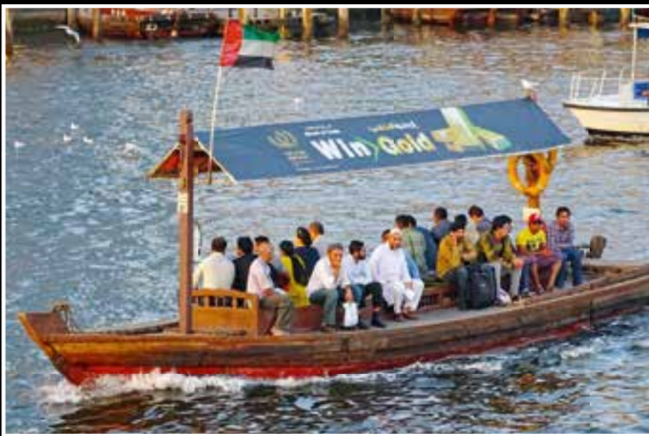
Mit solchen Booten sind die Menschen in Dubai unterwegs.

Unser Basislager für sieben Tage war das Novotel Deira City Center. Nach dem Frühstück starteten wir zu einer ganztägigen Stadtrundfahrt. An glitzernden Hochhausfassaden vorbei kamen wir zur Dubai Marina. Es ist ein Stadtteil mit über 140 Wolkenkratzern geflutet mit Wasserstraßen für Yachten. Das luxuriöseste Hotel der Welt, das Burj al Arab, befindet sich in diesem Stadtteil. Der Marina Walk liegt zwar im Schatten der Hochhäuser, jedoch ist das Angebot von Restaurants, Bars und Lounges nicht zu verachten. Das nächste Ziel war „The Palm Jumeirah“. Es sind künstliche Inseln in Form einer Palme. Sie besteht aus einem zwei Kilometer langen „Stamm“ und den 17 „Palmwedeln“. Am Stamm befindet sich eine Marina mit 600 Liegeplätzen für Yachten, auf den Palmwedeln gib es Millionen Euro teure Villen, zum Teil wie in einer Reihenhaussiedlung, sehr dicht nebeneinander. Durch einen Tunnel im Stamm gelangt man beim „Luxushotel Atlantis“ wieder ans Tageslicht. Das Hotel liegt auf einem Wellenbrecher, es ist ein rosafarbenes Prachtschloss mit vielen Türmen und Türmchen. In der neuen Downtown findet man die Dubai Mall mit 1200 Geschäften auf einer Million Quadratmeter.