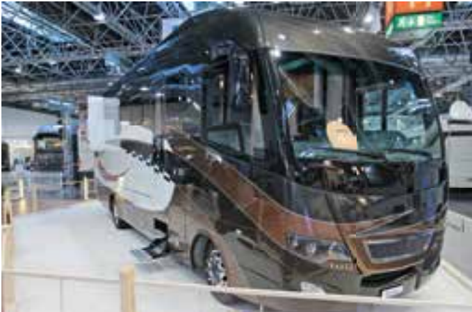
MAURER präsentierte auf dem Caravan Salon den Starliner D30 Quantum Edition. Das Mobil aus Schweizer Produktion kostet 875.755 Euro.