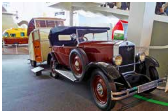
Caravanning in den Kindertagen im Erwin Hymer Museum in Bad Waldsee.

wenigstens ich den weiterhin fallenden Regen völlig ausgeblendet. Es war ein wirklich tief empfundenes Erlebnis, dieses Werk in der – fast – freien Natur in einer derartigen Starbesetzung erleben zu dürfen. Ich habe mich bei allem Erfasstsein vom Geschehen auf der wundervoll gestalteten Bühne, allem Wohlklang der Musik gestaltet vom Orchester und den Sängern, dem Chor und dem ästhetischen Tanz der Tanztruppe köstlich amüsiert über die Entchen, die lauthals quakend vor den Kulissen über das Wasser im strahlenden Licht der Scheinwerfern ihr Element verteidigten.