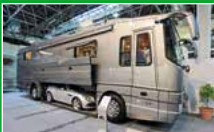
Salon: die große Neuheiten-Schau