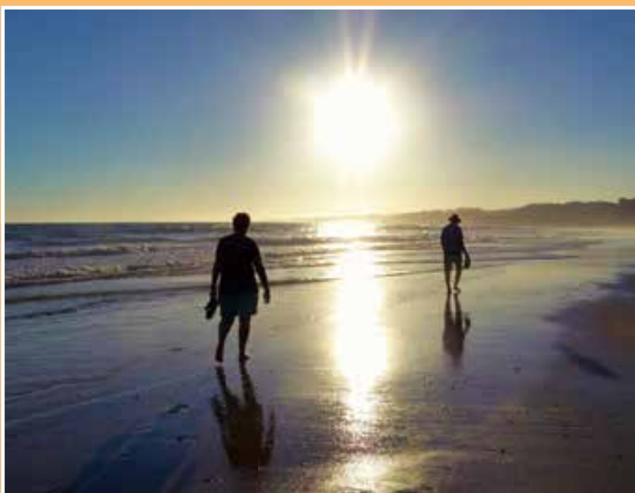
Abendstimmung am Strand.

Fátima ist einer der wichtigsten Wallfahrtsorte der christlichen Welt. Die Chronik notiert den 13. Mai 1917. Drei Hirtenkinder hüten die Schafe, als ihnen die Muttergottes in einer Steineiche erschien. Sie ermahnte die drei zu Gebeten und kündigte an, während der folgenden fünf Monate jeweils zur selben Zeit an die gleiche Stelle zu kommen. Ihre letzte Erscheinung am 13. Oktober endete mit dem Wunsch, zu ihrer Ehre eine Kapelle zu bauen. Man begann 1928 mit dem Bau der Basilika und der Anlage des riesigen Platzes, der doppelt so groß ist wie der Petersplatz in Rom. Mittlerweile zählt das Heiligtum der Fatima etwa vier Millionen Pilger jährlich und hat mehr Besucherbetten als Einwohner. Gegenüber der alten Kathedrale Basilica Antiga wurde 2007 die neue Kirche Igreja da Santissima Trindade eingeweiht. Sie ist mit annähernd 9000 Sitzplätzen die viertgrößte katholische Kirche der Welt und der bislang größte Kirchenneubau des 21. Jahrhunderts.