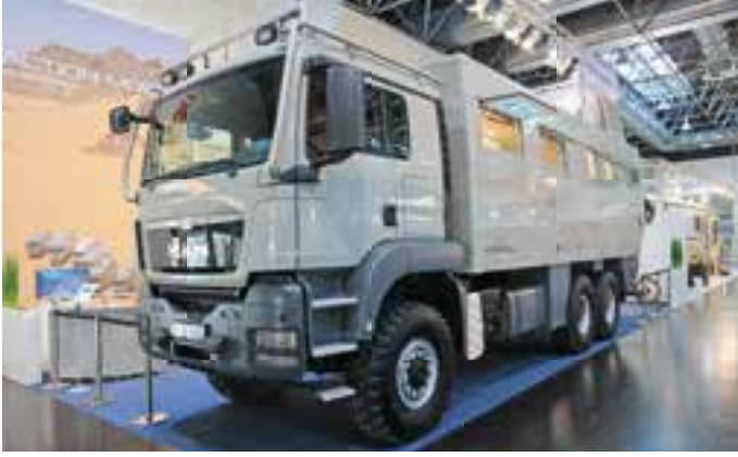
FÜRS GELÄNDE. Der Globecruiser 7600 von Action Mobil ist auch für extreme Touren abseits befestigter Pisten geeignet. Der Motor leistet 480 PS.