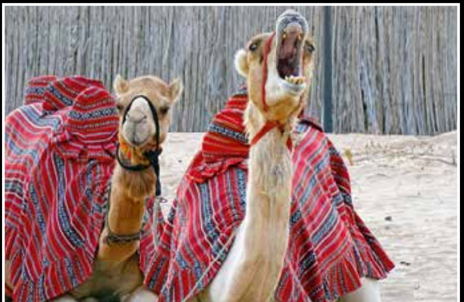
Kamele haben in Dubai immer noch einen hohen Stellenwert.