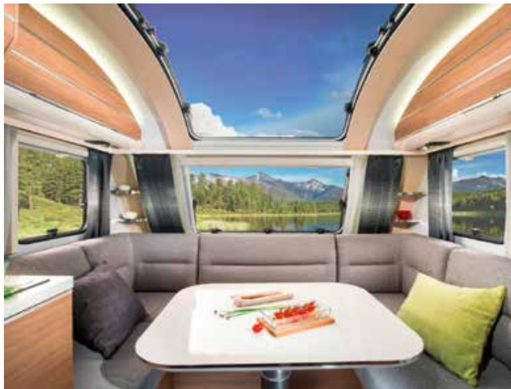
Für Adria entwickelte Polyplastic dieses beeindruckende Dachfenster.

Einzigartig ist auch ein neues Beschichtungsverfahren, das das Polyplastic-Acrylglas