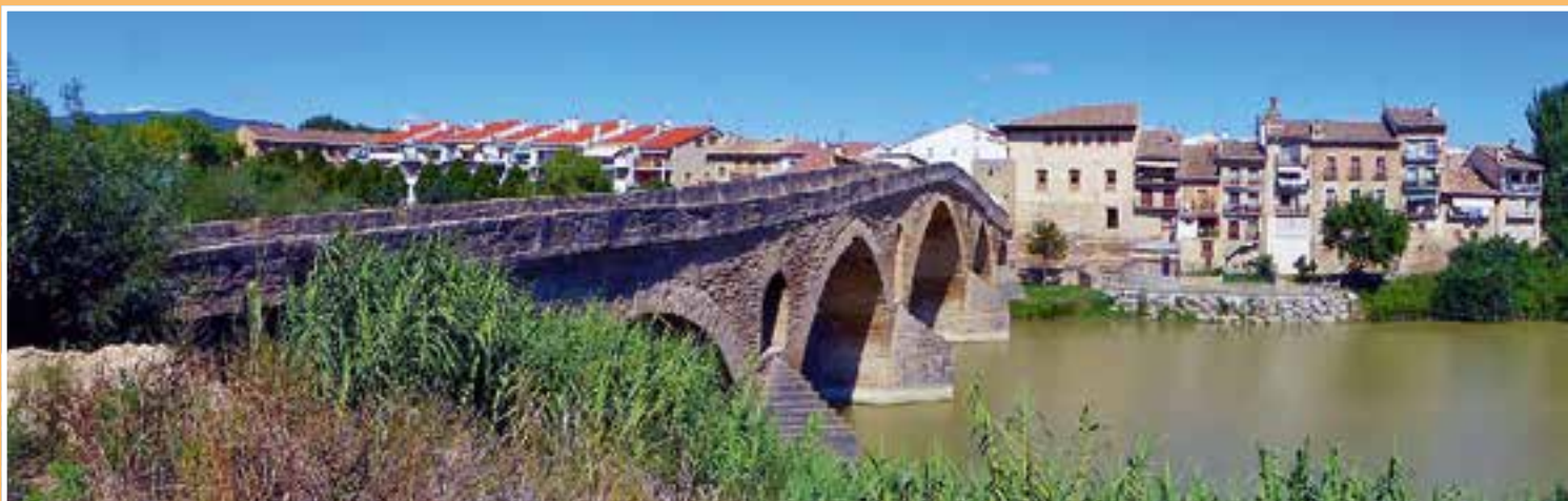
Die uralte Brücke von Puente la Reina.

Am nächsten Tag wollten wir es gemütlich angehen, es ging nicht, die einfallenden Badegäste hätten uns zugestellt und wir wären nicht mehr fortgekommen. Schneller Aufbruch und Fahrt zum Stellplatz im Raum Albufeira, diesen Platz hatten wir aus dem Reisemobilführer.