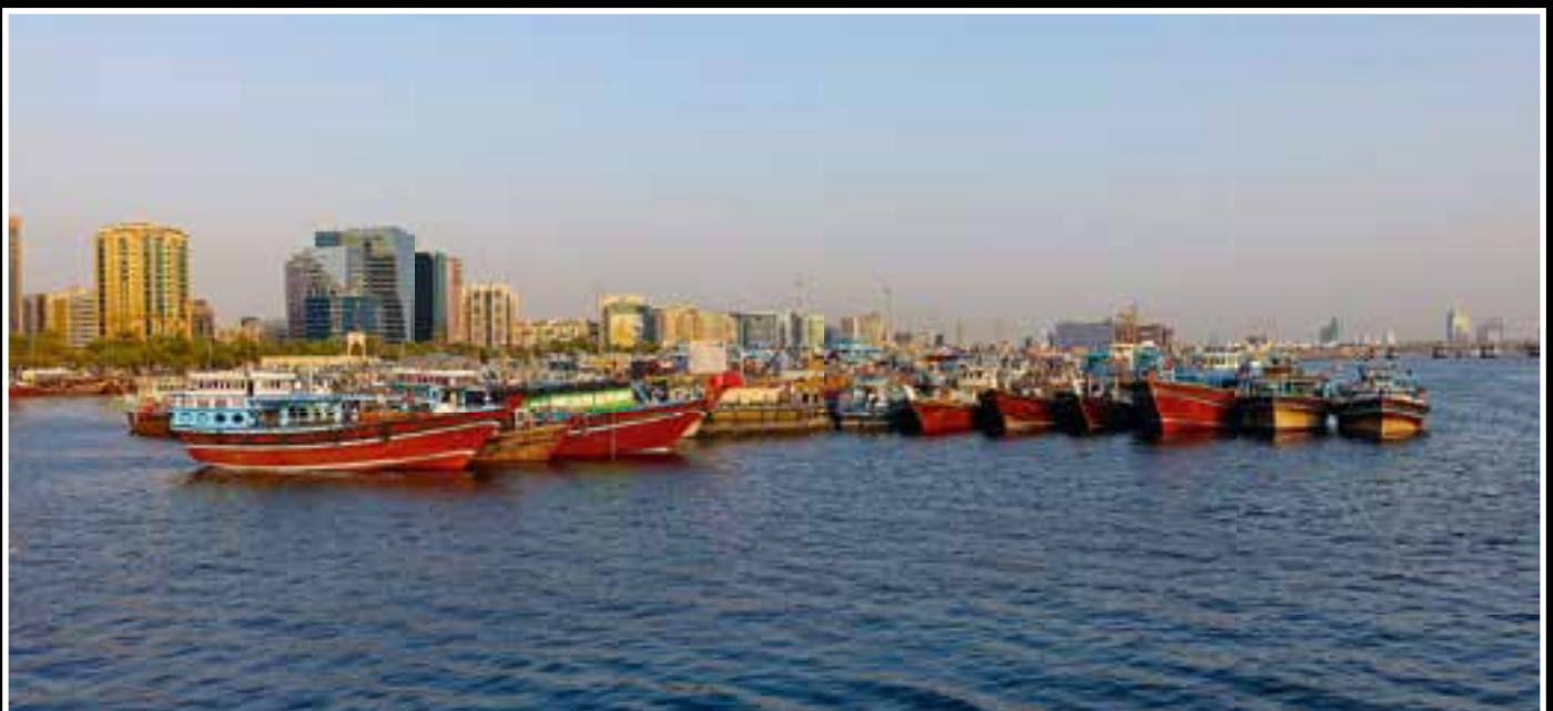
Die Dau-Schiffe liegen am Creek.