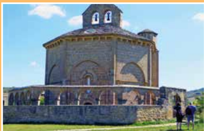
Die Kapelle Eunate.