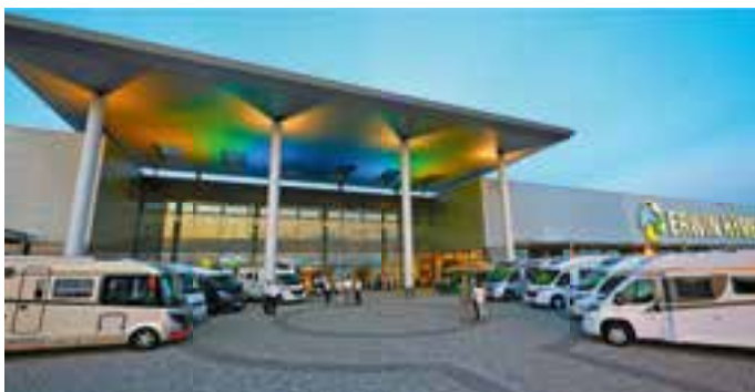
Aus dem Expocamp wurde in Wertheim am Main die Erwin Hymer World.