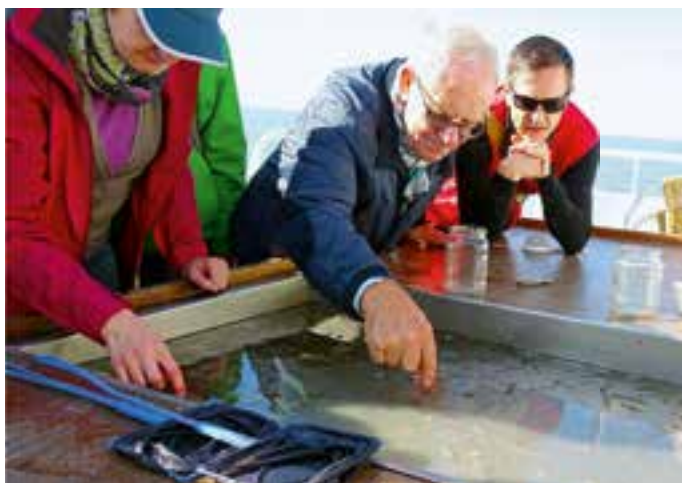
Bei der Begutachtung des Fangs auf der „Adler V“.