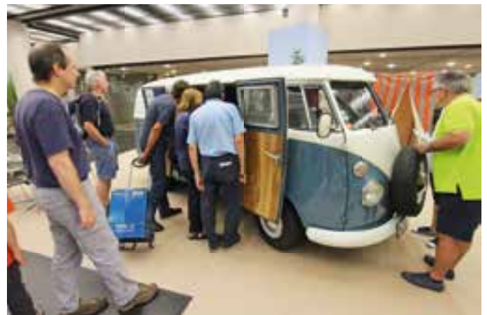
OLDIES. Die Oldtimer sind seit vielen Jahren ein fester Bestandteil des Caravan-Salons. Auch dieser VW T1 war ständig umlagert.

frieden äußerten sich auch die Aussteller, die durchweg von hohem Interesse und gestiegenen Verkäufen berichteten.