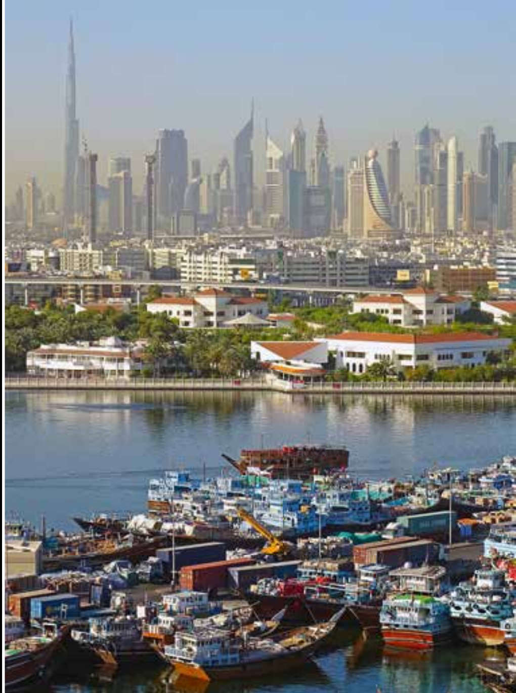
Dubai City mit Creek und Hafen.