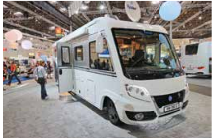
FLAGGSCHIFF: Der Sun I 900 LX ist das Flaggschiff von Knaus. In Düsseldorf war der noble Integrierte viel bestaunt.

bandes beigetragen habe. „Wir verzeichnen zum einen im Einsteigersegment bei den Marken Forster und Roller Team starke Zuwächse. Auf der anderen Seite ist die Nachfrage aber auch bei hochwertigen Fahrzeugen mit besonderen Designaspekten wie unserer Marke Mobilvetta groß.“