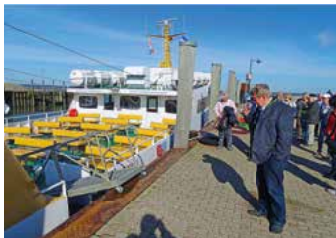
Mit dem Adler-Schiff ging es zur Hallig Gröde.

Abendessen mit anschließender fröhlicher Runde.