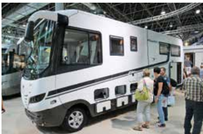
PHOENIX. Der Phoenix MaxiLiner 8100 RSLX ist 8,25 Meter lang und auf dem Iveco Daily 65 C 17 Euro V aufgebaut. Das perfekt ausgestattete Mobil ist ab 177.900 Euro zu haben.