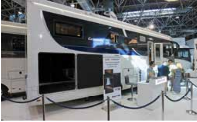
LINER PLUS. Der Liner Plus 996 L von Concorde ist bereits für 279.400 Euro zu haben. Das Ausstellungsstück auf dem Düsseldorfer Salon war mit 353.340 Euro ausgezeichnet.