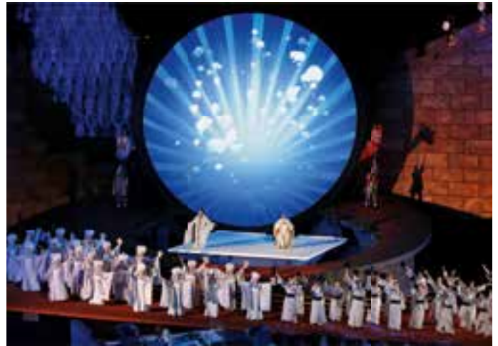
Phantastisch: Die Turandot-Aufführung in Bregenz.