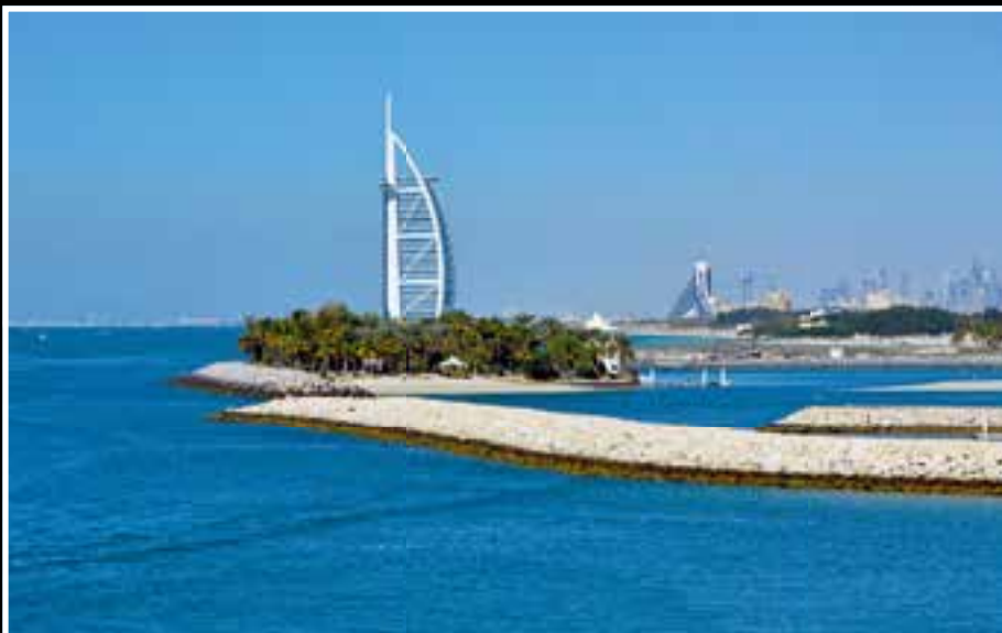
Das Hotel Burj Al Arab ist eine beeindruckende Landmarke.

In der Dubai-Mall befindet sich die Attraktion Ski Dubai. Auf der Größe von etwa drei Fußballfeldern wurde auf 6000 Tonnen Schnee eine Indoor-Skiarena ge-