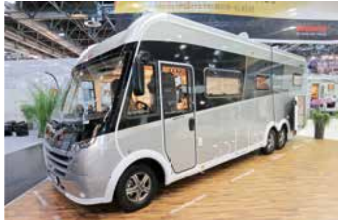
FÜR ANSPRUCHSVOLLE. Mit dem Globetrotter XLi Premium 7850 2-EB will Dethleffs anspruchsvolle Kunden ansprechen. Das Mobil ist für 113.499 Euro zu haben.