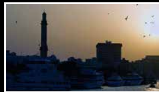
Sonnenuntergang am Creek in Dubai.

Nach dem Abendessen ging es nochmals zum Dubai Fountain am Fuße des Burj Khalifa. Jede halbe Stunde kommen über 6500 Lichter, 50 Farbprojektoren und Musikuntermalung zum Einsatz, um die Besucher mit einer prachtvollen Brunnenshow zu unterhalten. Die Er-