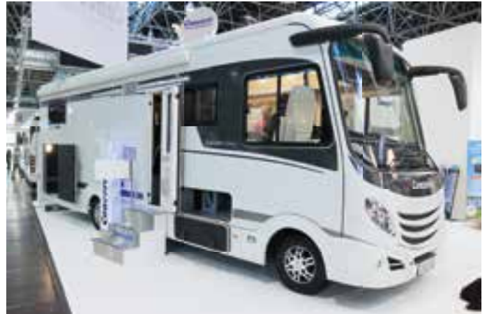
KOMPLETT. Der Carver 894 L von Concorde ist komplett ausgestattet. Das in Düsseldorf ausgestellte Fahrzeug hatte einen Preis von 242.140 Euro.