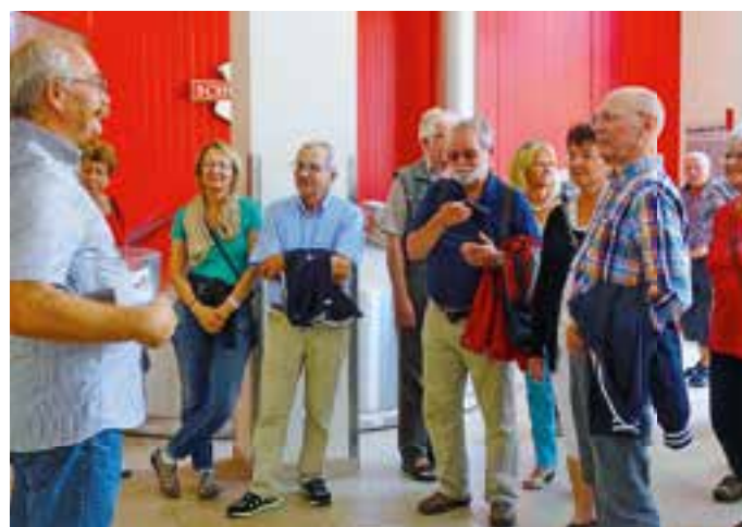
Die EMHC-Mitglieder bei der Führung im Schussenrieder Brauhaus.