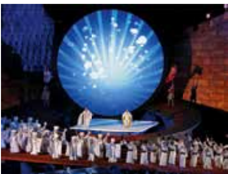
Die Turandot-Aufführung in Bregenz. S. 8