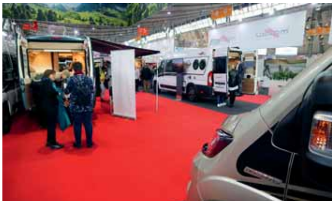
Zahlreiche Premieren sind für die CMT 2022 in Stuttgart angekündigt.