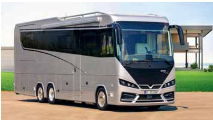
Starker Auftritt: Der der Vario Perfect 1200 Platinum ist mit seinen zwölf Metern Länge ein Mobil der Superlative.

Ab 9,5 Meter Länge werden individuelle Vario-Mobile inklusive PKW-Garage in der Bohmter Reisemobilmanufaktur gefertigt. Ein Mini Cabrio