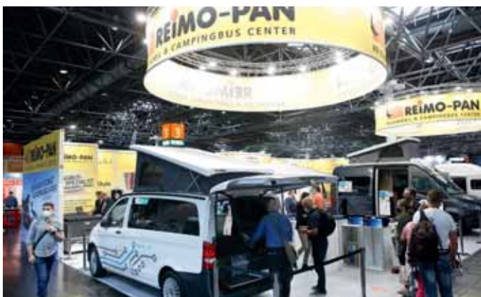
Kompakte Mobile sind eine Spezialität von Reimo.

Rapido. Der französische Hersteller Rapido brachte einen neuen Grundriss seiner teilintegrierten C-Serie mit nach Düsseldorf. Den C50 mit höhenverstellbarem Queensbett. Zwei weitere neue Modelle ergänzen die Vollintegrierten der 8F-Baureihe. Der 854 F bietet dank optionaler Hubbetten auf 6,70 Metern Länge bis zu sechs Schlafplätze. Der 855F reserviert den Raum hingegen für zwei Personen. Eines der beiden Einzelbetten ist dank einer Länge von 2,04 Metern auch für großgewachsene Reisende geeignet. Zudem nutzte Rapido den Anlass seines 60. Gründungsjubiläums für die Auflage der Sonderserie 60 Edition, in der sich sechs verschiedene Reisemobile aus allen Baureihen mit attraktiven Ausstattungspaketen versammeln.