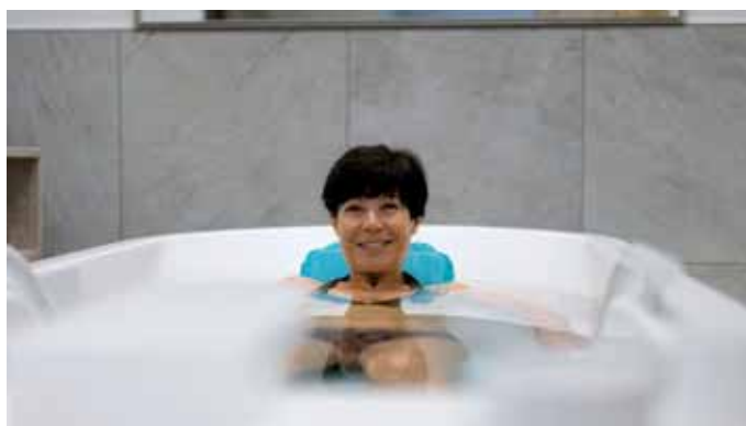
Während des Treffens besteht auch Gelegenheit, sich in der Caracallawanne der Frankenthalertherme zu entspannen.