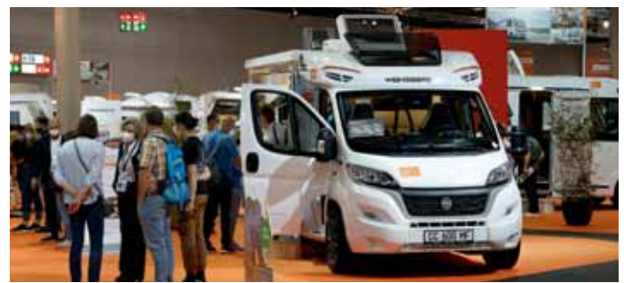
Weinsberg setzt verstärkt auf Leichtbau.

Westfalia. Westfalia stellte zwei neue Sondermodelle auf dem Caravan-Salon aus. Den rund sechs Meter langen Columbus 600 E mit Einzelbetten auf Basis des Fiat Ducato und den ebenfalls rund sechs Meter langen Meridian auf Basis des Ford Transit. Umfangreiche Ausstattung soll die Besucher von den Vorzügen der beiden Westfalias überzeugen.