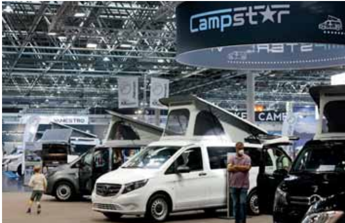
Kompakte Mobile präsentierte Campstar.