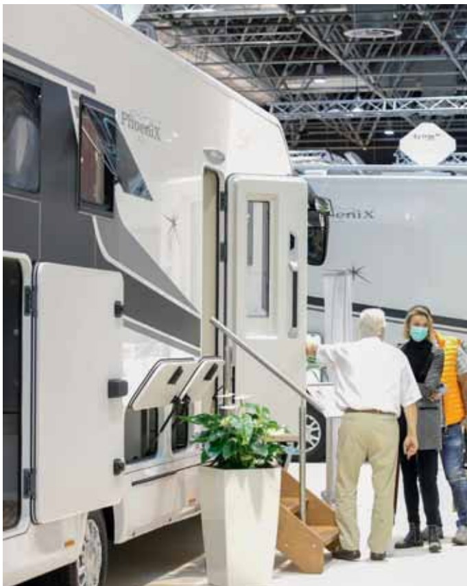
Phoenix-Mobile strahlen im neuen Außendesign.

ist hier ein Doppelbett als Hubbett in Längsrichtung angeordnet. Darunter entsteht ein in der Höhe variabler größer Stauraum für Fahrräder, Motorroller oder anderes sperriges Sportgerät.