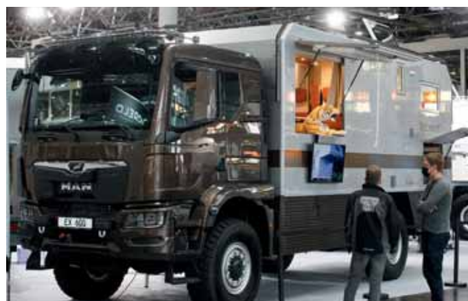
Modelle von Bimobil haben eine feste Fangemeinde.

Chausson. Mit dem 660 Exclusive Line und der S-Bau-reihe präsentierte Chausson drei neue Grundrisse seiner teilintegrierten Reisemobile. Das Modell überrascht mit zwei Türen, die in den Wohnraum führen. Eine an der üblichen Stelle auf der Beifahrerseite, eine auf der Fahrerseite im Heck. Der so leichter zugängliche Stauraum im Heck sowie das Bad und der Küchenblock sind durch einen leichten verglasten Raumteiler optisch getrennt. Davor liegt eine Sitzgruppe. Geschlafen wird in einem elektrisch absenkba-ren Hubbett. Die vollintegrierten Chaussons werden ebenfalls um ein neues Modell ergänzt. Der neue 7020 setzt auf eine geräumige Längsbanksitzgruppe und ein gro-