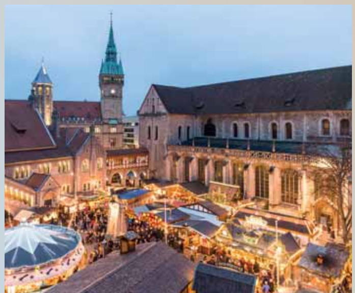
(Der Braunschweiger Weihnachtsmarkt ist einer der schönsten in Norddeutschland.