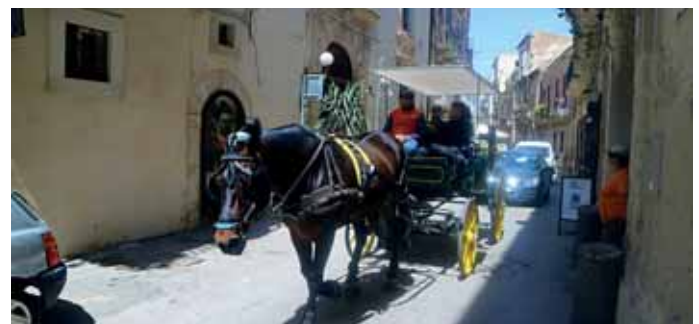
Wer will, kann sich in einer Kutsche durch die engen Straßen von Syrakus fahren lassen.

Kreuzrippengewölben sind neben den außergewöhnlichen Kapitellen auch die auf zisterziensische Zusammenhänge (Kloster Clairvaux) zurückführbaren Kastenrippen jedes Gewölbes. Ursprünglich wies das Kastell ein oder zwei obere Geschosse auf. Der heutige, breit gelagerte Eindruck ist das Ergebnis eines Umbaus während der spanischen Herrschaft in Süditalien, als bei vielen mittelalterlichen Kastellen die oberen Geschosse