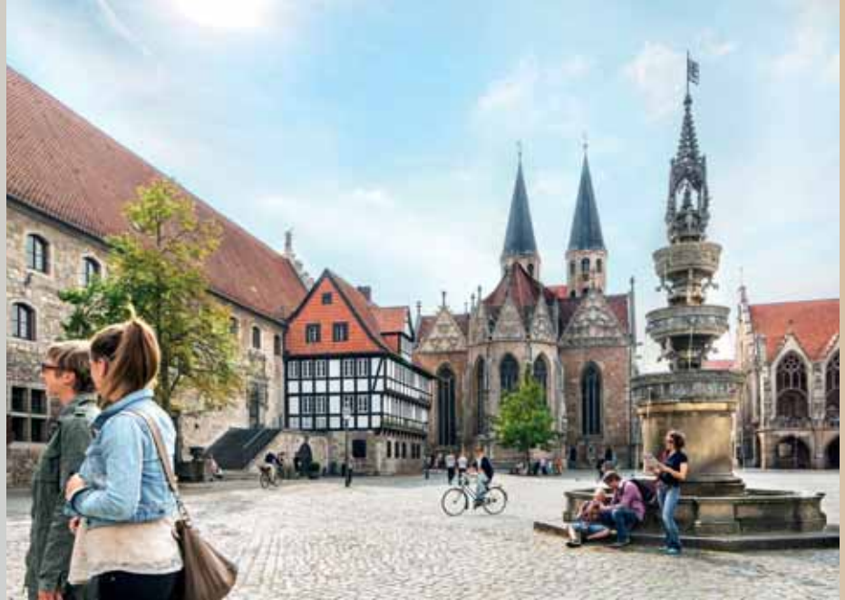
Mittelalterliches Flair am Altstadtmarkt.