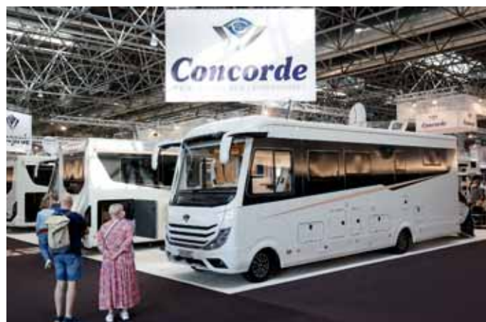
Viele Neuheiten bei Concorde im Modelljahr 2022.