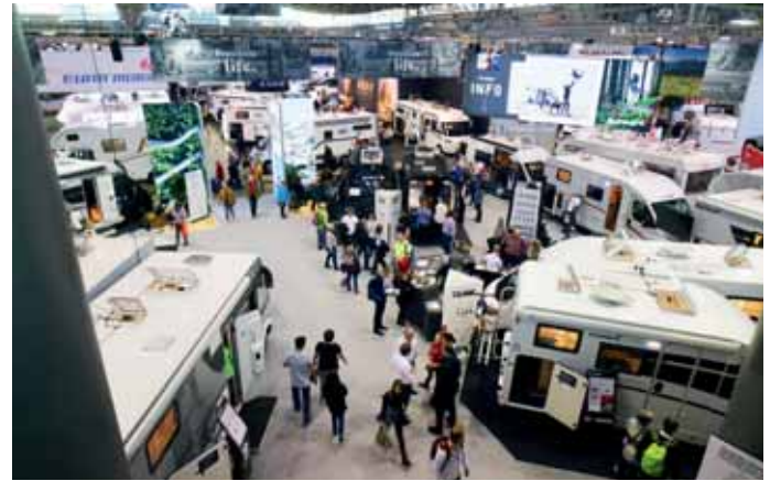
Die CMT gilt in der Reisemobilbranche als Auftakt in die Reisesaison. Die Hersteller sehen dem Event mit Optimismus entgegen.

Neu auf der CMT in Stuttgart: Vom 20. bis 23. Januar finden Tauchbegeisterte in der Halle 9 alles für den