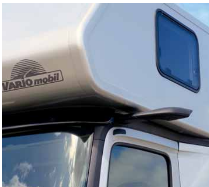
Nicht alltäglich: Das große Vario-Alkovenmobil hat keine ausladenden Rückspiegel, sondern unauffällige Kameras.

kann durch Seilwindeneinzug oder mit dem noch komfortableren automatischen Schiebepalette in der passgenauen Heckgarage platziert werden. Die große hydraulisch öffnende Heckklappe schützt während des Verladevorgangs vor sengender Sonne und auch bei Regen. So gestaltet sich Multifunktionalität: kein Umrangieren, kein entweder oder, einfach mehrfach fahrbereit.