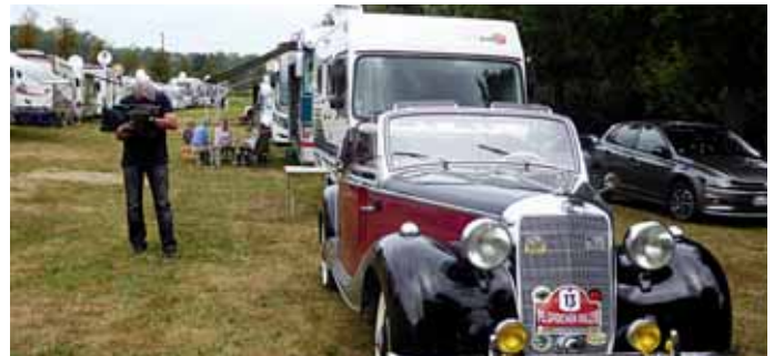
Der Oldtimer zwischen Reisemobilen war wieder einmal ein Blickfang.