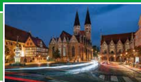
Auf Tour: Braunschweig ist immer eine Mobilreise wert