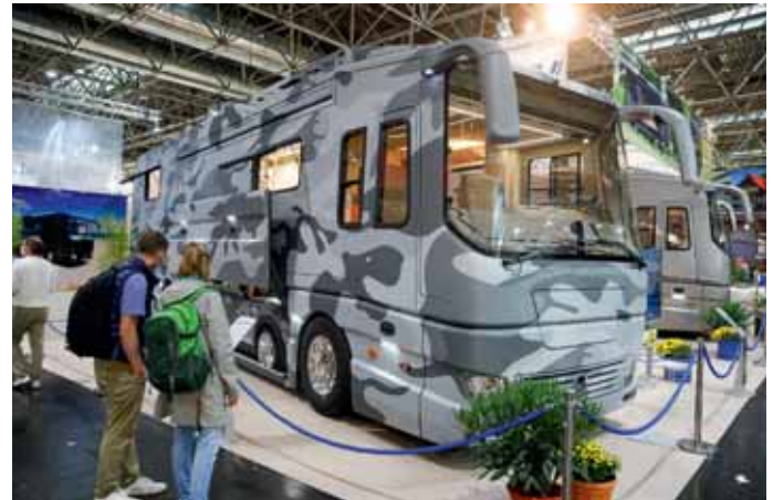
Traumobil: der neue Volkner Elfer Performance.

Reimo. Kaum war der neue Volkswagen Caddy Maxi auf dem Markt, machte Reimo daraus ein kompaktes Campingmobil, das auf dem Salon Premiere feierte. Blickfang war das neue Reimo-Schlafdach, das hinten hochklappt und eine Schlaffläche von 195 mal 100 Zentimeter bietet. Wird die Schlaffläche unter dem aufgeklappten Dach befestigt, entsteht im Caddy Stehhöhe. Alternativ kann das neue Schlafdach auch auf den XL-Versionen der Pkw der Marken Citroën Berlingo III, Peugeot Rifter/Partner III, Opel Combo E und Toyota Proace City montiert werden.