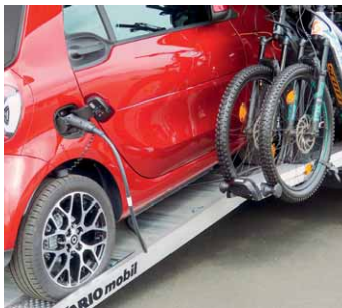
Prima Idee: Bei Vario wird die Heckgarage auf Wunsch zur Ladestation für elektrisch angebotene Autos oder Räder.

Neu im Programm ist der Vario Perfect 800 auf MAN TGL 8.220. Es ist definitiv ein Komfortmobil bei nur 8 Metern Fahrzeuglänge. Das auf zwei Personen ausgelegte Mobil rollt mit moderner neuer Front aus der kompakten Vario-Perfect-Familie auf der Basis des MAN TGL mit 231 PS. Ausgeliefert wird es mit aufwendiger Metallic-Lackierung. Das Luxusmobil bietet trotz wendiger Außen-