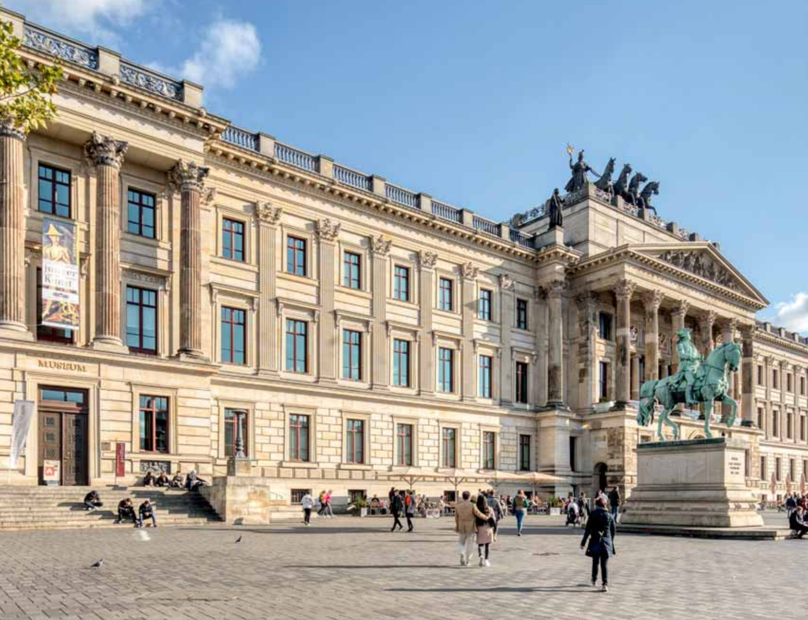
Imposante Fassade: das Braunschweiger Schloss.