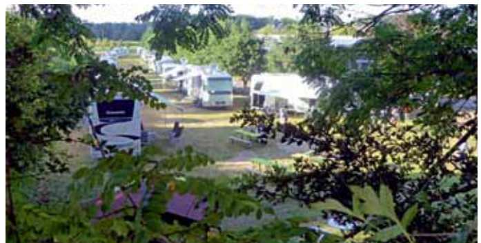
Im Grünen hatten sich die EMHC-Mitglieder niedergelassen.