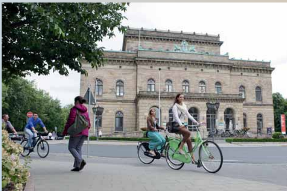
Mit seiner Topografie ist Braunschweig eine ideale Radfahrerstadt.