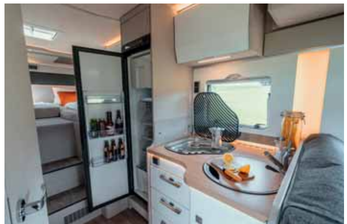
Zweckmäßig präsentiert sich die Kücheneinrichtung. Der große Kühlschrank gehört zur Serienausstattung.