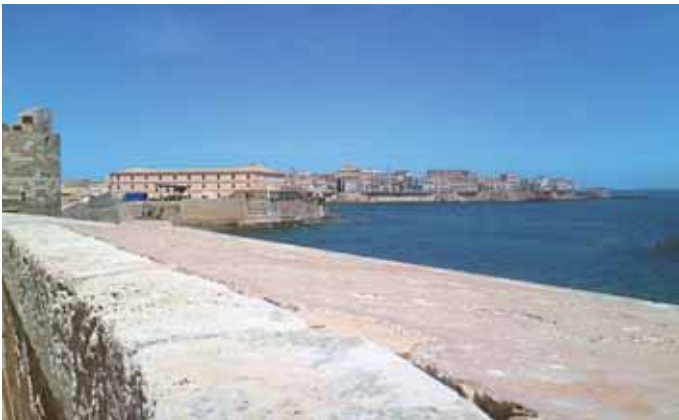
Der Blick vom Castello Maniace auf die Altstadt von Syrakus auf der Insel Ortigia.