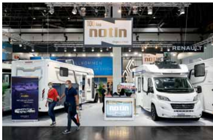
Noble Mobile aus Frankreich: Notin.

der Royale Line 3 smart neue Fernsehsysteme auf den Markt, die sowohl in Anschlussspannungen von 9–30 Volt als auch 100–240 Volt arbeiten. Zudem sind die Geräte gegen Erschütterungen und Vibrationen geschützt. Der Triple Tuner sichert den digitalen Empfang im europäischen Ausland. Die Fernseher sind in den Größen 19, 22, 24 und 32 Zoll erhältlich. Die Smart-TV-Systeme verfügen zudem über einen Internetbrowser und vorinstallierte Apps für viele Streamingportale.