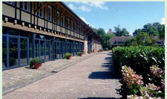
Im englischen Stil präsentiert sich der frühere Gutshof heute als komfortables Hotel.