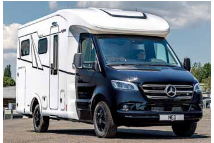
Schwarzes Fahrerhaus, weißer Aufbau: Die neue Neo Blackline von Frankia fällt auf.

Die Heckgarage weist eine Höhe von 1,20 Meter auf. Der beheizte Doppelboden misst 20 bis 40 Zentimeter Höhe und ist nach vorne durchladbar. Reichlich Stauraum bieten Bordfächer, ein Kleiderschrank unter dem Bett und ein zusätzlicher Schrank im neuen Neo BD ein Stauraum unter der Sitzgruppe mit Zugang zum Doppelboden. Die Zuladung beträgt mehr als 500 Kilogramm beim 3,5-Tonner und über 1.500 Kilogramm beim 4,5-Tonnen-Modell. Die durchgehende Innenraumhöhe beträgt zwei Meter bei 2,90 Meter Gesamthöhe des Fahrzeugs. Aus der Sitzgruppe kann schnell und einfach