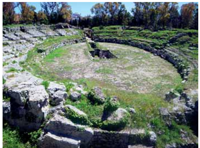
Das römische Amphitheater von Syrakus stammt aus dem 3. Jahrhundert nach Christus. Der Bühnenraum ließ sich mit Wasser füllen, so dass hier sogar Seeschlachten nachgestellt werden konnten.