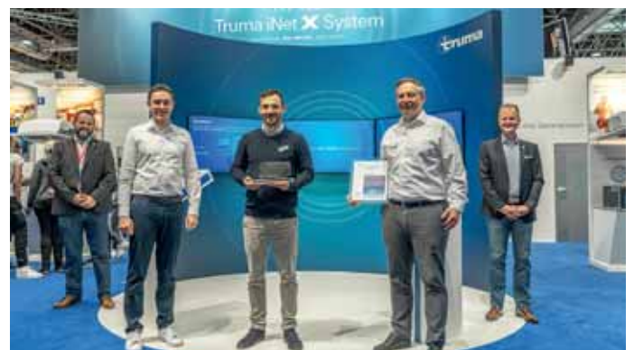
Freude am Truma-Stand über die Verleihung des Branchen-Oscars „Lupo“ durch den Händlerverband DCHV.