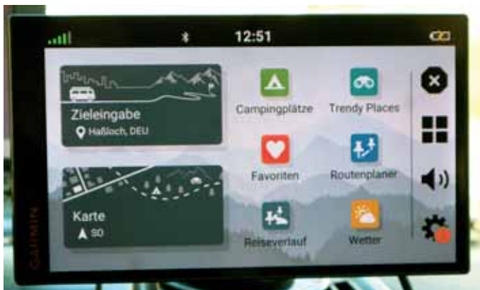
Eine Stärke des neuen CamperVan-Navigationsgeräts von Garmin ist das helle und klare 7-Zoll-Display.