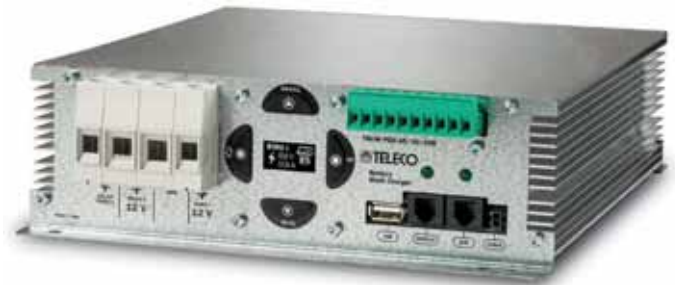
Feines Äußeres mit High-Tech-Inhalt: Das neue Ladegerät TBCM PRO 45/30/350 von Teleco.

Verglichen mit der früheren Version, konnte die Ladeleistung für Aufbau-Batterien von Freizeitfahrzeugen verbessert werden: Der Spitzenwert des Ladestroms von der Lichtmaschine zum Konverter hat sich von 30 A auf bis zu 45 A gesteigert; der Spitzenwert des Ladestroms verbunden mit dem AC-Netz hat sich von 20 A auf 30 A verbessert; die Spitzenkapazität der Solarmodule, die von dem MPPT-Regler gemanagt wird, steigerte sich von 250 auf 350 Watt. Es ist außerdem möglich, ein externes Bedienpanel mit OLED-Display zu installieren, das über die gleiche Optik wie bspw. die Bedienpanels der automatischen Sat-Anlagen der Teleco-Produktfamilie verfügt.