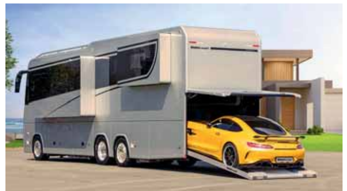
Erker an der Seite und ein Porsche in der Heckgarage: So rollt der der Vario Perfect 1200 Platinum auf MB Actros 2553 LLL an.