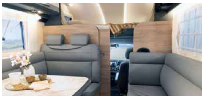
Hochwertige Materialien prägen das Interieur. Der Zugang zum Fahrerhaus lässt sich verschließen.

rerhaus. Nach hinten folgen die Küche und das Raumbad mit separater Dusche und Toilettenraum, das zum Wohnraum hin abschließbar ist. Unterschiede gibt es beim Schlafraum im Heck. Während das Modell Globetrotter XXL A 9050-2 mit mittigem Queensbett aufwartet, verfügt das Schlafzimmer des Globetrotter XXL A 9000-2 über zwei Einzelbetten, die sich zu einer Liegewiese umbauen lassen.