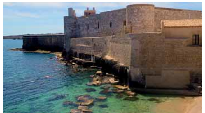
An der Südspitze der Insel Ortigia liegt das Castello Maniace. Benannt ist es nach dem griechischen General Georg Maniakes.