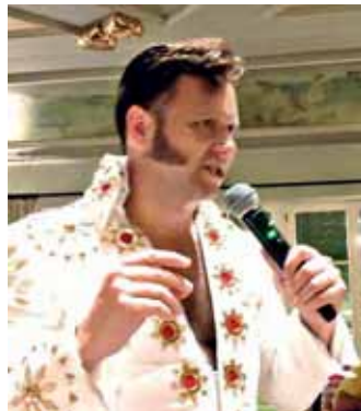
Der Elvis-Imitator begeisterte das EMHC-Publikum.