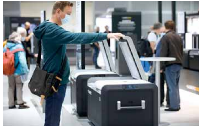
Großes Interesse für die neuen Dometic-Kühlboxen.

Dometic. Der weltgrößte Zubehör- und Komponenten-Lieferant der Caravaningindustrie bot in Düsseldorf zahlreiche Produkte aus den Themenbereichen Klima und Komfort, Essen und Trinken, Hygiene und Sanitär, Energie und Steuerung sowie Sicherheit und Schutz an. Zu den neuen Produkten zählten die drei neuen robusten Patrol-Eisboxen. Diese haben anspruchsvolle Praxistests unter härtesten Outdoor-Bedingungen bestanden. dwt Zelte. Der Vorzeltspezialist stellte das neue Luftzelt Picco Air für Campingbusse vor. Es passt an Campingbusse mit einer Höhe zwischen 180 und 220 Zentimetern, wiegt zwölf Kilogramm und erweitert den Wohnraum auf einer Fläche von 3,2 mal 1,5 Metern vor dem Fahrzeug.