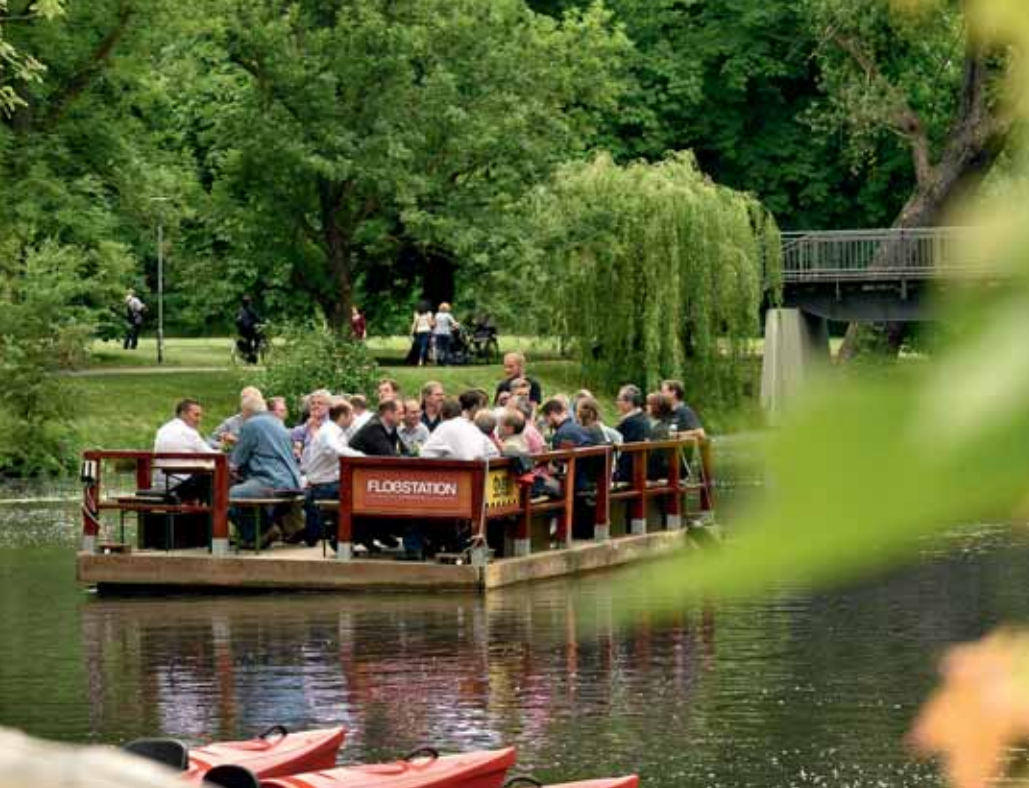
Ein beliebter Treffpunkt ist das Okercabana.