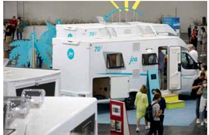
Erstmals auf dem Salon: die neue Marke Joa Camp.