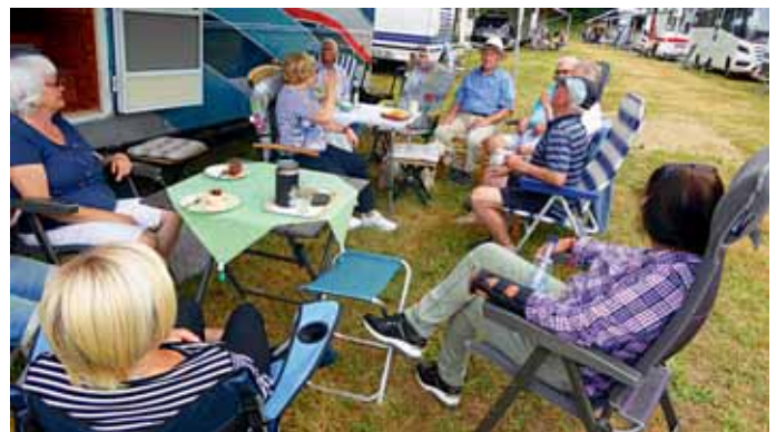
In geselligen Runden tauschten sich die Mitglieder aus.