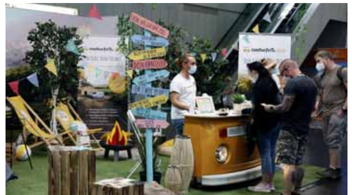
Reisedestinationen waren auch in diesem Jahr gefragt auf dem Salon.