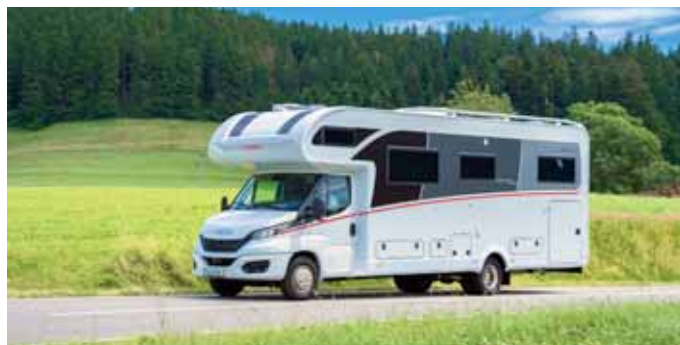
Stattliche Erscheinung: Mit einer Länge von 8,86 Metern ist der Globetrotter XXL A das größte Reisemobil des Herstellers aus dem Allgäu.

Auch im Modelljahr 2022 ist der Globetrotter XXL A in zwei Grundrissen erhältlich. Beide verfügen über eine Dinette mit gegenüberliegenden Sitzbänken und seitlich an der Wand angeschlagenem Tisch hinter dem Fah-