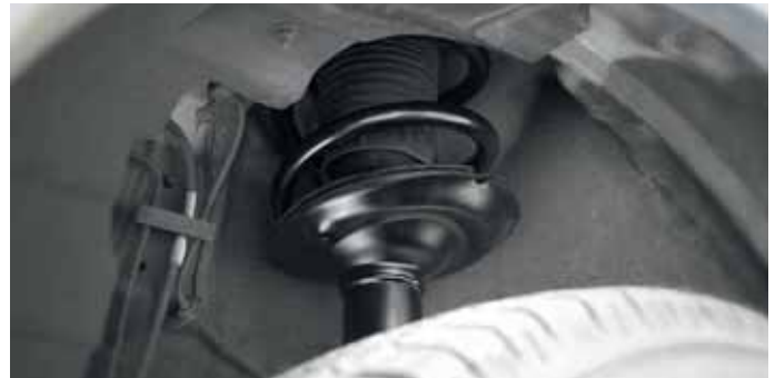
Die neuen Federbeine der Serie „RouteComfort Evo“ sind für den Fiat Ducato, Peugeot Boxer und Citroën Jumper ab Baujahr 2006 erhältlich.

Ebenfalls neu im Goldschmitt-Programm sind Luftfederungen für den VW T5, T6 und T6.1. Für diese Modelle bietet Goldschmitt eine neue, komfortablere Vollluftfederung für die Hinterachse an. Neben den bewährten Varianten mit robusten Doppelfaltenbälgen kommen bei der neuen Version großvolumige Kegelbälge zum Einsatz, die für noch mehr Fahrkomfort an der Hinterachse sorgen sollen.