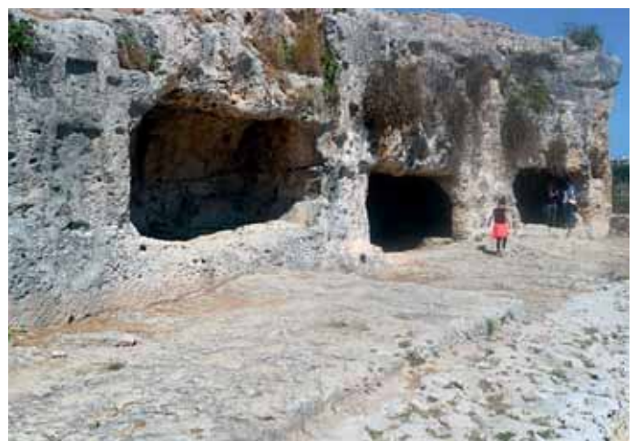
In den großen Steinbrüchen (Latomien) von Syrakus wurden Kalksteine zum Aufbau der antiken Stadt gewonnen.