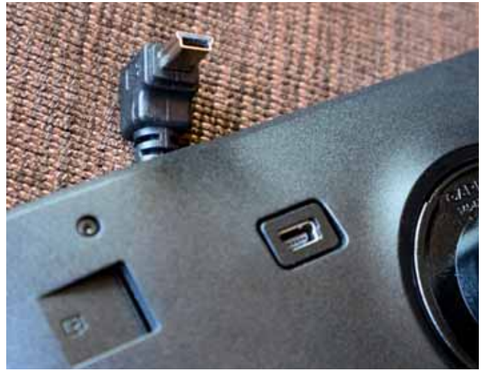
Merkwürdig: Garmin nutzt im neuen Navi einen veralteten USB-Mini-B-Stecker.

Im Vergleich zu anderen Geräten ist das neue Garmin-Navi beim Start und bei der