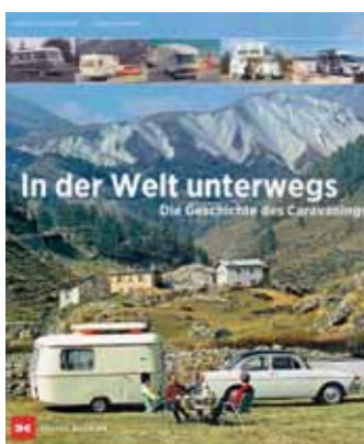
Interessante Bücher S. 20