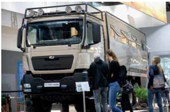
Hingucker: die luxuriösen Geländefahrzeuge von Action Mobil.

te. Die noblen Spitzenmodelle chic c-line „superior“ heben sich mit einem eigenständigen Exterieur noch weiter ab. Schließlich gehen die dreiachsigen Spitzenmodelle chic c-line XL nun ebenfalls auf Mercedes-Benz Sprinter an den Start. Insgesamt gibt es jetzt alternativ zum Fiat Ducato eine Flotte von zehn chic c-line mit Stern. Basisfahrzeug Fiat Ducato oder Mercedes-Benz Sprinter, XL-Modelle auf drei Achsen, Integrierte und Teil-