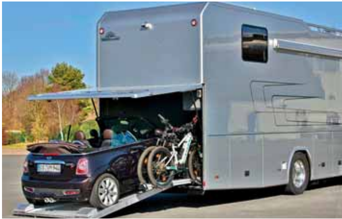
Der Mini kann im neuen Vario Alkoven 1050 transportiert werden. Daneben finden auch noch Fahrräder Platz in der Heckgarage.