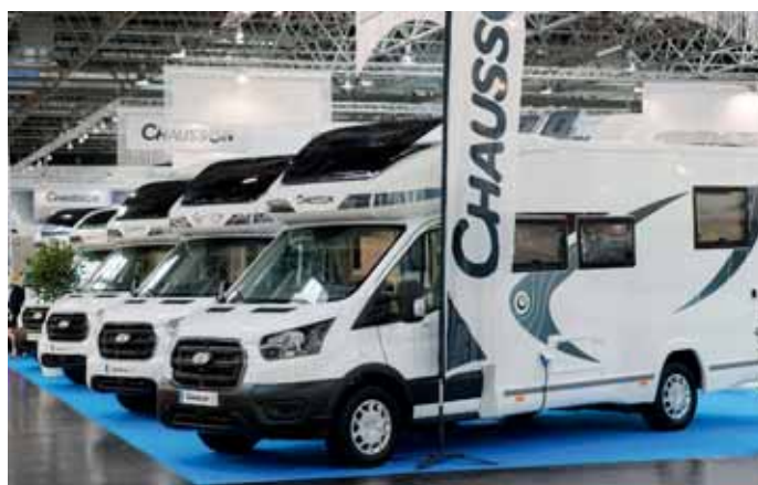
Chausson baut auf die Ford-Basis.

integrierte Varianten – das summiert sich auf 26 neue Carthago Reisemobile.