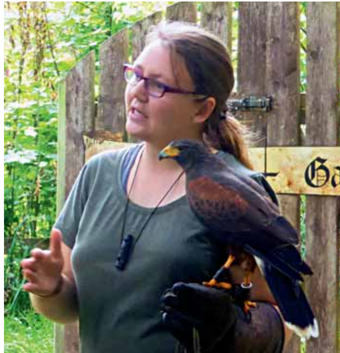
Die Falknerei gehört zum Linslerhof. Interessiert lauschten die EMHC-Gäste den Erklärungen.

Umgebung. Zur großen Überraschung vieler kam ein TV-Team auf den Platz: Der Saarländische Rundfunk (SR) berichtete über das Mobiltreffen. Das war eine gute Reklame für den EMHC.