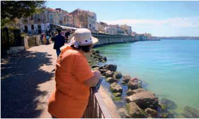
Die Strandpromenade, der Foro Vittorio Emanuele II, lädt zum Bum-meln ein.