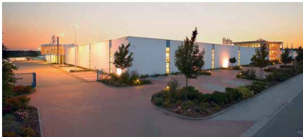
Das Hobby-Reisemobilwerk in Rendsburg gehört zu den modernsten Fertigungsstätten in Europa.

Nach der Flucht aus der durch den Krieg zerstörten ursprünglichen Heimat Ostpreußen, wurde seine Familie mit großer Hilfsbereitschaft in Fockbek und Schleswig-Holstein aufgenommen. Mit der Gründung der gemeinnützigen Stiftung möchte er seinen tiefen Dank gegenüber der Region zum Ausdruck bringen.