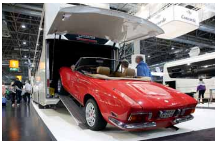
Bei Concorde lässt sich der kleine Flitzer mitnehmen.

Dreamer. Auf dem Caravan-Salon feierte der ausgebauter Kastenwagen Dreamer Fun D55 Up Premiere. Der D 55 ergänzt den Grundriss mit Querbett im Heck durch ein Hubdach hinter dessen Zeltbahn weitere zwei Personen im Obergeschoss eine Schlafstätte finden.