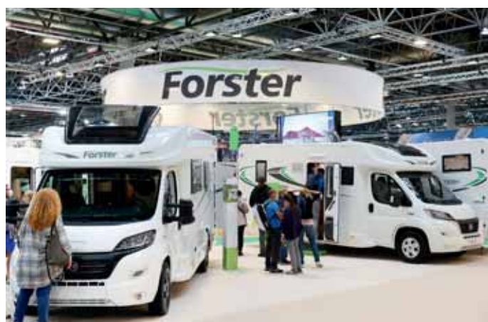
Forster bleibt auch 2021 in der Erfolgsspur.

det sich ein mit Riffelblech, Verzurrösen und Auffahr-rampe ausgestatteter Lade-raum der auch für Motorroller und leichte Motorräder Platz bietet. In den Baureihen Profila T und RS sowie Integra Line ergänzt nun jeweils ein 720 QF-Grundriss mit der Face-to-Face-Sitzgruppe das Angebot. Eine