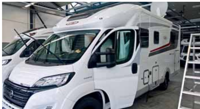
Wie neu strahlen die versiegelten Wohnmobile. Der Schutz hält garantiert mehrere Jahre.

Auch für etwas ältere Reisemobile ist eine Keramikversiegelung durchaus ein Thema, denn üblicherweise hat ein Freizeitfahrzeug bereits nach drei Jahren etliche leichte Kratzer auf den Acryl-