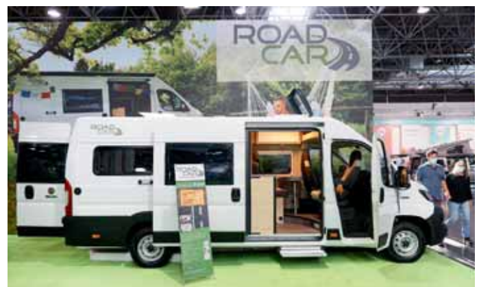
Für Kastewagen-Fans: Roadcar.