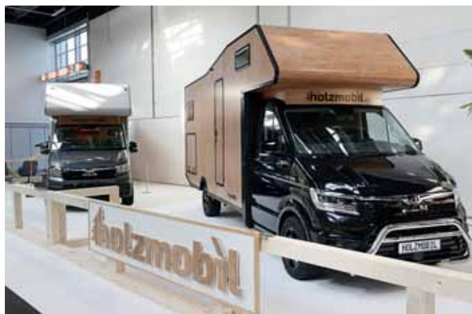
Ungewöhnliches Äußeres: die Holzmobile aus Villingen im Schwarzwald.

In diesem Jahr feierte die Halle 3 beim Caravan-Salon Premiere. Hier präsentierten die Aussteller aus den Bereichen Equipment & Outdoor sowie Travel & Nature ihr Angebot. „Wir sind sehr zufrieden und stellen fest, dass vor allem die Besucherstruktur herausragte. Das Publikum war sehr qualifiziert