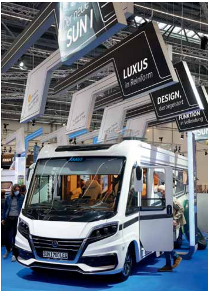
Knaus belegte wieder eine ganze Messehalle.

in die Welt der Hobby-Campervans vor. Die zwei Modelle der Baureihe verfügen neben einer üppigen Grundausstattung über ein umfangreiches Ausstattungspaket, zu dem unter anderem ein Gasflaschenauszug für zwei 11-Kilogramm-Flaschen, Sat-Anlage mit TV-Kombination und ein Hightech-Navi-