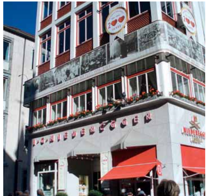
Ein Besuch im berühmten Café Niederegger darf beim Ausflug nach Lübeck nicht fehlen.

Das EMHC-Treffen endet am Sonntag, 27. März 2022, mit dem traditionellen Frühstücksbuffet. Die Anmeldung zum Kohl- und Pinkel-Treffen soll bis zum 16. Januar 2022 bei Arnold Golin, Zum Karpfenteich 3 c, 23795 Fahrenkrug, Tel: 01 72-526 1792, E-Mail: a.golin@gmx.de, erfolgen. Die Teilnehmergebühr beträgt 340 Euro für ein Mobil mit zwei Personen und 200 Euro für Einzelfahrer. Überweisungen werden erbeten auf das Konto IBAN DE28 2307 0700 0254 2058 00, BIC DEUTDE33, bei der Deutschen Bank. Die Überweisung gilt als Anmeldung.