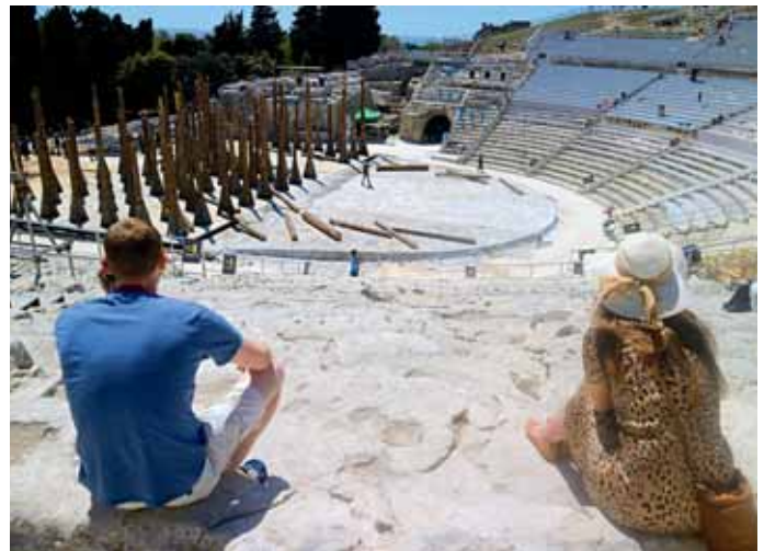
Im Teatro Greco finden dort im Sommer regelmäßig Theateraufführungen und Konzerte statt. Es bot einst 15.000 Zuschauern Platz.

Die Altstadt auf der Insel Ortigia drohte nach dem Zweiten Weltkrieg zu verfallen. Viele Bewohner zogen in die modernen Wohnviertel auf dem Festland um. Durch umfangreiche Sanierungs- und Restaurierungsarbeiten von 1990 an wurde die Altstadt wieder aufgewertet und belebt. Auf Ortigia befindet sich auch ein Großteil der historischen Bauten und Sehenswürdigkeiten.