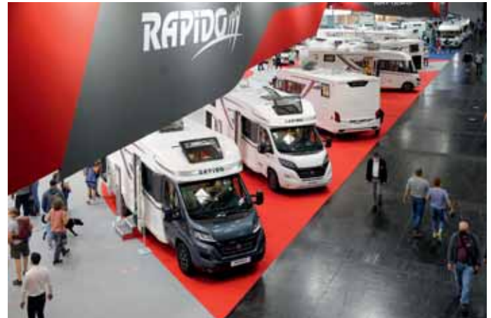
Die breite Modellpalette bei Rapido.