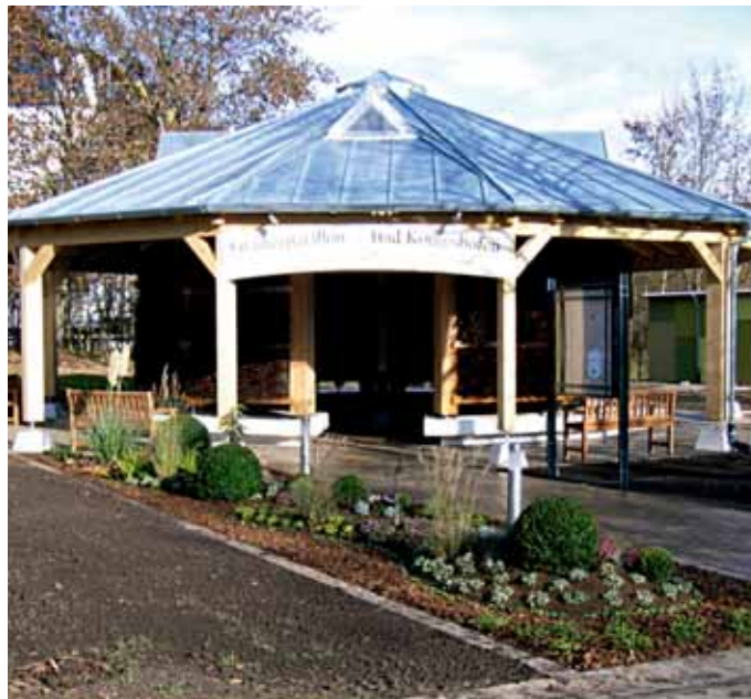
Im Gartenpavillon soll die Begrüßung der Teilnehmer des EMHC-Nikolaustreffens 2021 erfolgen.

Am Samstag, 4. Dezember, gibt es ab 8.30 Uhr wieder den Brötchenservice mit der Zeitung am Stellplatz. Um 11 Uhr ist ein Kinobesuch in dem kleinen familiengeführten Kino in Bad Königshofen geplant. Es wird ein aktueller Film gezeigt. Am Nachmittag besteht die Möglichkeit zum Besuch der Frankenthalertherme. Jeder Teilnehmer des Treffens erhält einen Gutschein für einen Badbesuch von zwei Stunden. Um 18.30 Uhr startet der Festabend mit einem Drei-Gänge-Menü. Die Getränke müs-