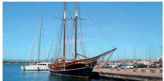
Im Hafen von Syrakus legen gern auch die Besatzungen historischer Schiffe an.

An der Südspitze von Ortigia liegt das Castello Maniace. Benannt ist es nach dem griechischen General Georg Maniakes, der die Stadt 1038 mit Hilfe normannischer Söldner für einige Jahre für das byzantinische Reich zurückerobern konnte. Das Castello Maniace erhebt sich über einem viereckigen Grundriss. An jeder Ecke befindet sich ein runder Eckturm. Der Innenraum bestand aus einem einzigen, gigantischen Saal, dessen Decke von großen Kreuzrippengewölben getragen wurde, die auf riesigen Säulen ruhten. Diese Säulen wurden von außergewöhnlich reich skulptural geschmückten Kapitellen bekrönt, die in der weltlichen Baukunst des Mittelalters rund ums Mittelmeer einzigartig sind. Auffällig an den