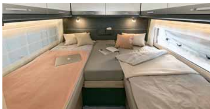
Qual der Wahl: Interessenten können den Globetrotter XXL A von Dethleffs mit Queensbett oder mit Einzelbetten bestellen.