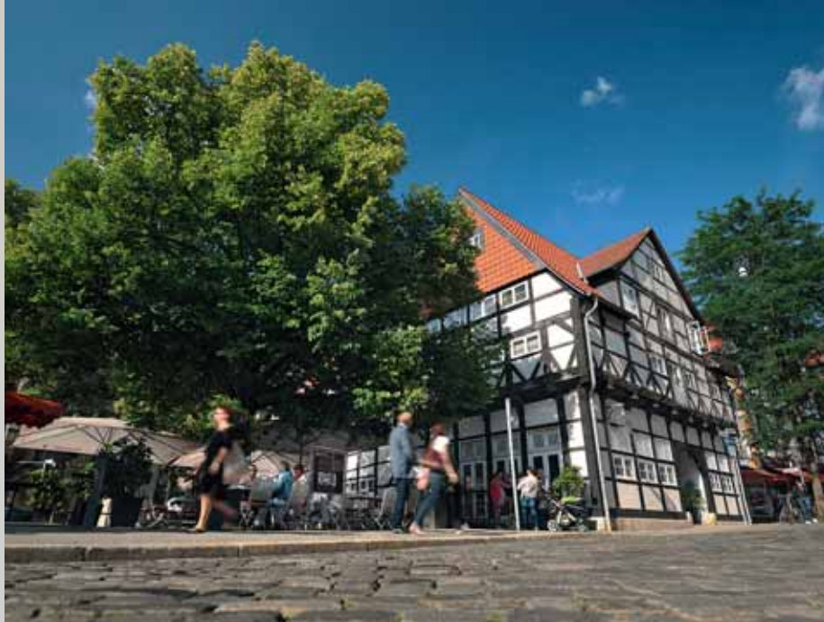
Es macht Spaß, im Magniviertel zu bummeln.

Aufgrund ihrer günstigen Lage am Schnittpunkt bedeutender Fernhandelswege war die Löwenstadt im Mittelalter und in der frühen Neuzeit ein bedeutendes Handels- und Gewerbezentrum, das schon seit dem 13. Jahrhundert intensiv mit anderen Hansestädten handelte. In die Politik der Hanse brachte sich die Stadt Braunschweig aktiv ein und entsandte seit 1356 auch Vertreter zu Hansetagen. Die Mitgliedschaft in der Hanse endete, als die Stadt 1671 ihre Unabhängigkeit verlor und die Braunschweiger Fürsten die Macht übernahmen. Geblieben sind steinerne Zeugnisse dieser Epoche der Stadtgeschichte wie das Altstadttrathaus, das Gewandhaus, die (rekonstruierte) Alte Waage, die städtischen Pfarrkirchen und verschiedene Bürgerhäuser.