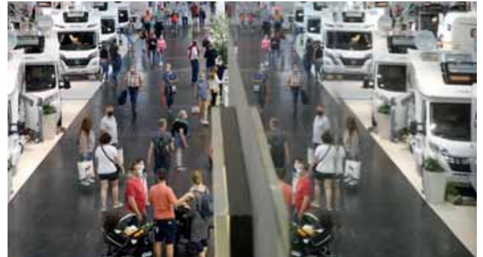
Spiegelbild in Halle 9: Rund 185.000 Besucher wurden in diesem Jahr auf dem Caravan-Salon in Düsseldorf gezählt.