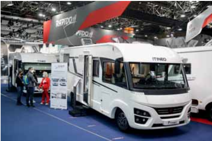
Solide mobile Mittelklasse: Itineo.