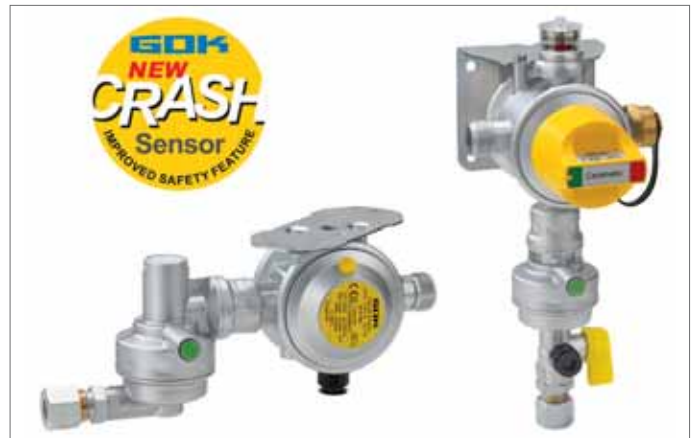
Die neuen Gasdruckregelanlagen von GOK sollen für noch mehr Sicherheit in Reisemobilen sorgen.

Die Bauform beizubehalten, war eine bewusste Entscheidung, denn nach zehn Jahren im Einsatz muss die Gasdruckregelanlage getauscht werden. Die Caramatic DriveTwo und Caramatic DriveOne haben den Vorteil, dass sie baugleich mit den silberfarbenen Modellen MonoControl CS und DuoControl CS von Truma sind. Das gewährleistet einen einfachen Eins-zu-Eins-Tausch bei zigtausend Gasdruckregelanlagen, die in Wohnmobilen eingebaut sind.