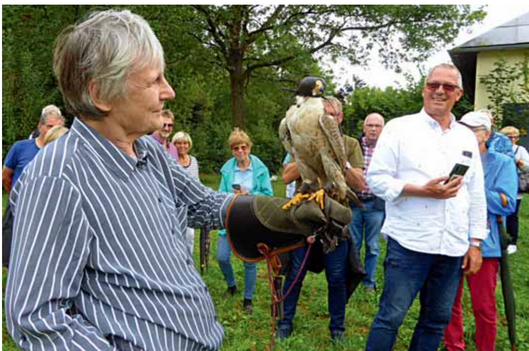
Freiwillige vor: Einige EMHC-ler trauten sich, Falken auf den Handschuh zu nehmen.

hat teilweise eine große Bedeutung auf Flughäfen bei der Vertreibung von Vogelschwärmen. Auch zur Jagd auf Kaninchen in Parks und Wohngebieten werden mancherorts Falken eingesetzt. Bei der Beizjagd auf Rebhühner und Fasane ist ein guter Vorstehhund unverzichtbar, der das Wild sicher vorste-