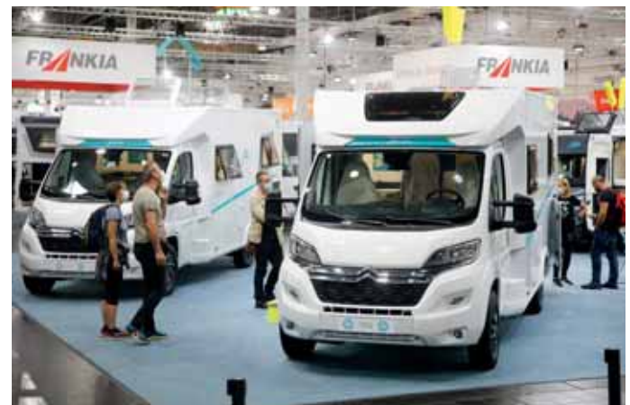
Frankia kam mit neuen Modellen nach Düsseldorf.