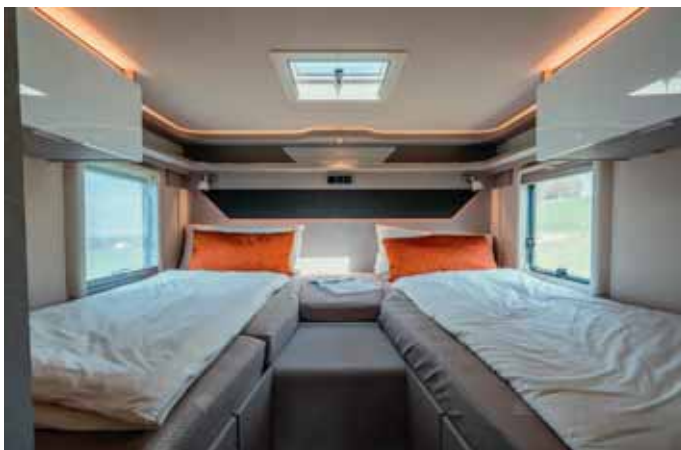
Zwei komfortable Einzelbetten sind im Heck des Tramp 585 untergebracht.

Der Hymer Tramp S 585 ist ab sofort bestellbar.