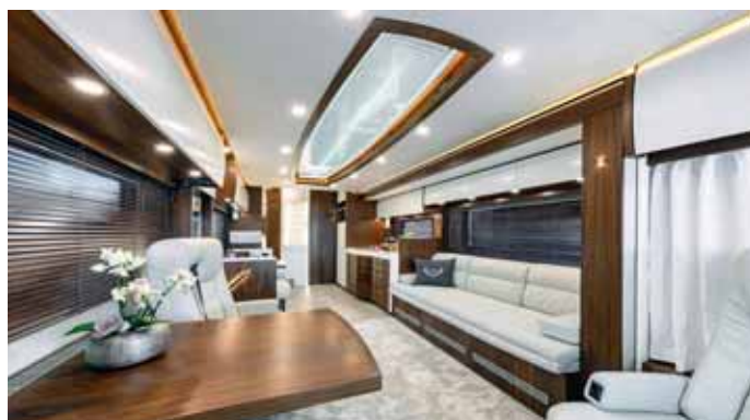
Weiß und Nussbaum: Die Kombination der Inneneinrichtung des Vario Perfect 1200 Platinum kann sich sehen lassen.

Weitere Infos unter www.vario-mobil.com .