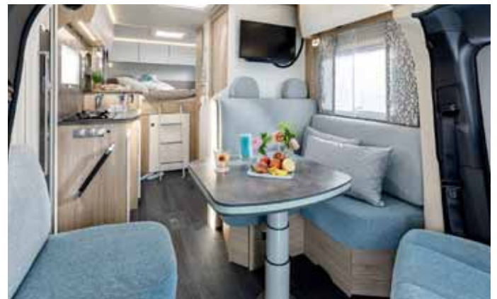
Im Inneren des neuen Frankia Neo mit dem Querbett im Heck.