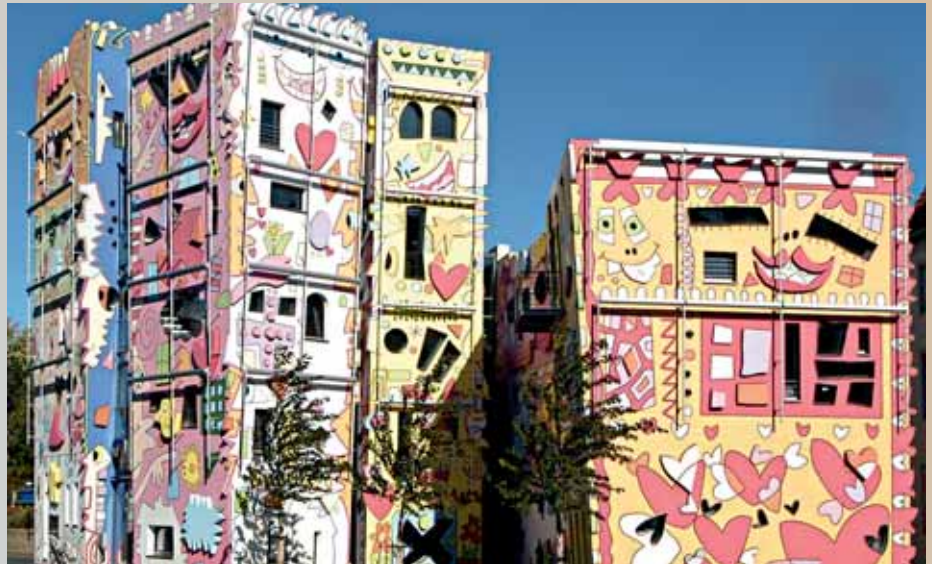
Moderne Kunst ist Stein geworden: das Rizzi-Haus in Braunschweig.

In Braunschweig gibt es viele grüne Oasen. Weil sich die Oker wie ein Ring um die Innenstadt legt, sind Parks und Naturlandschaften in der Löwenstadt auch von der Innenstadt schnell zu erreichen. Stadtnahe Seen und das europäische Vogelschutzgebiet in Riddagshausen sind für die Braunschweiger reizvolle Naherholungsmöglichkeiten. Mit der günstigen Lage zum Harz und zur Lüneburger Heide ist die Löwenstadt auch idealer Ausgangsort für Ausflüge in eine bemerkenswerte Kulturregion.