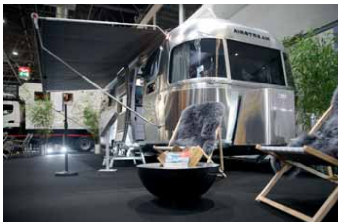
Der kultige Airstream-Caravan aus den USA war wieder ein Hingucker.

Caravan-Salon ist für uns äußerst zufriedenstellend verlaufen und zeigte, dass die Caravaning-Welt noch digitaler, globaler und schnelllebiger sein wird. Auch und gerade in Zeiten der Pandemie sehnen sich die Menschen noch stärker nach Unabhängigkeit, Freiheit, Natur und individuellen Auszeiten.“