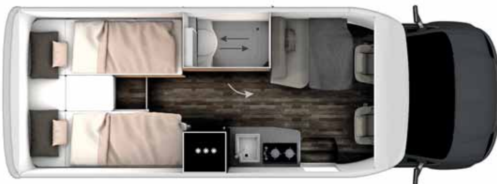
Das Modell Blackline GD ist ein klassischer Einzelbetten-Grundriss.

Der Basispreis des Frankia Neo BD oder GDK liegt bei 77.900 Euro, die Black Line-Modelle sind ab 88.900 Euro zu haben.