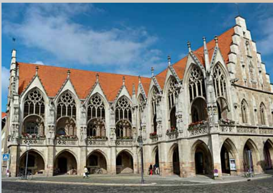
Das Altstadttrathaus präsentiert sich mit gotischen Strukturen.