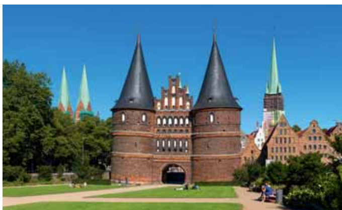
Bekannt vom 50-Mark-Schein: das Holstentor in Lübeck.

Tel. 02776/92290 info@sv-happel.de www.sv-happel.de