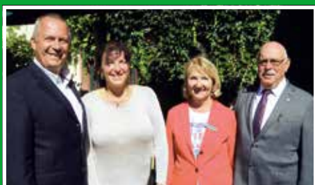
Stabwechsel: Der EMHC hat einen neuen Präsidenten

Der neue Vario Perfect 800 auf MAN TGL 8.220