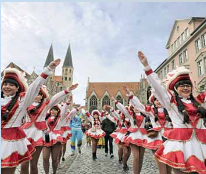
Der Karneval wird in Braunschweig feste gefeiert.