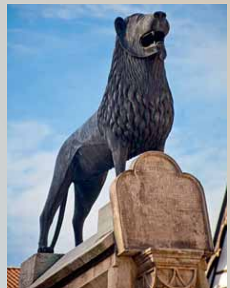
Stolz erhebt sich der Braunschweiger Löwe am Burgplatz.

Seit der Stadtgründung durch Heinrich den Löwen wurde Braunschweig über die Jahrhunderte durch die Welfen und die Hanse geprägt. Heute ist Braunschweig mit rund 250.000 Einwohnern die größte Stadt zwischen Hannover und Berlin: Sie überzeugt als attraktive Einkaufsstadt, lebendige Kulturstadt und als Zentrum der forschungintensivsten Region Europas. Das Mittelalter wird hier in den verwinkelten Gassen des Magniviertels mit kleinen Fachwerkhäusern oder auf dem Burgplatz mit seinen historischen Gebäuden ebenso erlebbar wie das urbane Lebensgefühl in der pulsierenden Einkaufsstadt. Auf kurzen Wegen ist alles zu erreichen, was eine Großstadt ausmacht – genauso wie die herrlichen Park- und Naturlandschaften, die entlang des Flusses Oker am Rand der Innenstadt für Ruhe und Ausgleich sorgen.