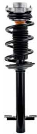
Die neuen Goldschmitt-„RouteComfort Evo“-Federbeine sind im Vergleich zu ihren Vorgängern mit Stoßdämpfern ausgestattet, die durch ihre automatische Dämpfungskraftverstellung für eine optimale Dämpfung bei allen Fahrbahnbeschaffenheiten sorgen.

Wie auch die Systeme mit Doppelfaltenbälgen lässt sich auch die neue Komfortluftfeder mit den Luftfederbeinen der Vorderachse kombinieren. Somit wird es neben einem 2-Kanal-System für die Hinterachse auch eine 4-Kanal-Variante für Vorder- und Hinterachse geben. Auch das OmniRoad-Fahrwerk, das den VW-Transporter geländegängiger macht, ist mit der neuen Luftfederung an der Hinterachse kombinierbar. Alle Vollluftfederungen von Goldschmitt sind mit der Steuerung AirDriveControl ausgestattet. Mit dieser lassen sich viele verschiedene Funktionen und Positionen abrufen. Die Luftfederungen