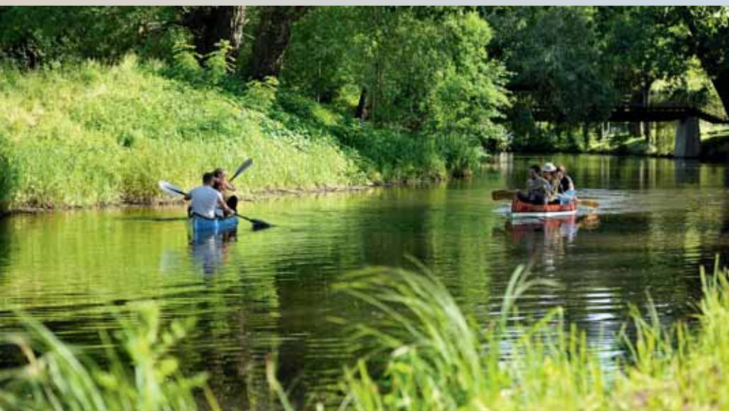
Der Bürgerpark an der Oker ist eine grüne Lunge der Stadt.