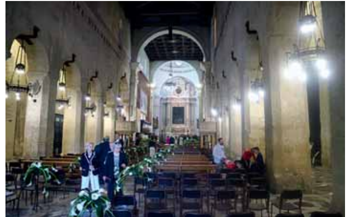
Der Dom von Syrakus geht auf den Apollontempel aus dem 6. Jahrhundert vor Christus zurück. Er gilt als ältester und größter griechischer Tempel Siziliens.