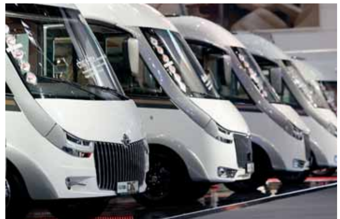
Gleich 26 Premieren gab es bei Carthago.