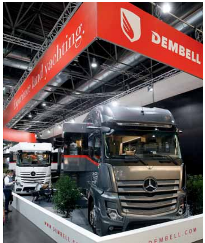
Neue Marke in der Mobilen Premier League: Dembell.

Eura Mobil. Zum Modelljahr 2022 steigt auch Eura Mobil ins Segment der ausgebauten Kastenwagen ein. Die Baureihe Eura Mobil Van startet mit drei Grundrissen und Premium-Anspruch in das boomende Marktsegment. Neben zwei klassischen Grundrissen mit Querbett (595 HB) und Einzelbetten (635 EB) ist der 635 HB der ungewöhnlichste Kandidat der Baureihe. Das große Heckbett lässt sich elektrisch hochfahren. Darunter befinden