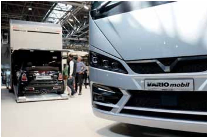
Für höchste Ansprüche: die neuen Modelle von Vario Mobil.