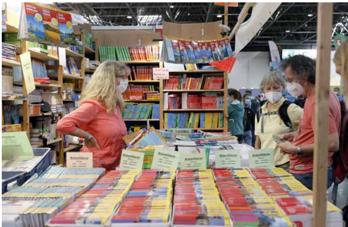
Bücher, Bücher, Bücher – sie haben auch im Digitalzeitalter noch ihre Fangemeinde.