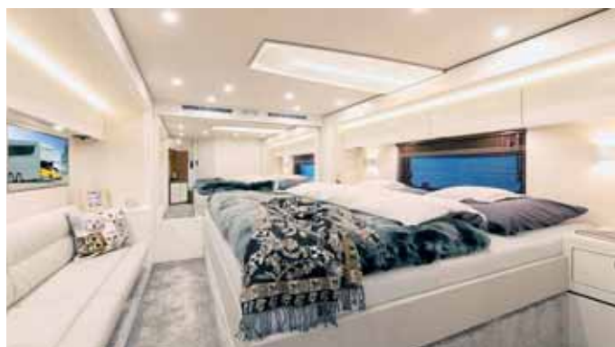
Schöner als in den meisten Häusern: Das Schlafgemach im neuen Vario Perfect 1200 Platinum.