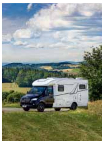
Neue Frankia-Mobile. S. 18