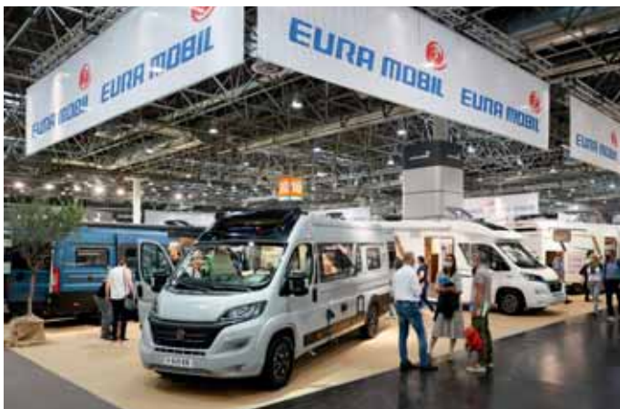
Eura Mobil stellte erstmals ausgebaute Kastenwagen vor.