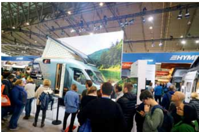
Im Januar 2022 werden Hymer-Reisemobile wieder auf der CMT in den Stuttgarter Messehallen zu sehen sein. Die Unternehmen der Erwin Hymer Group (EHG) beschlossen, in den geraden Jahren sowohl auf der CMT wie auch auf dem Caravan-Salon in Düsseldorf auszustellen.

genen Jahr sind in Deutschland zu den gut 3.000 Campingplätzen nur sechs neue hinzugekommen. Die gesamte Stellplatzfläche ist derzeit sogar leicht rückläufig. Hier brauchen wir unbürokratische und schnelle Genehmigungsverfahren. Mehr Stellplätze sind ein aktives Instrument zur regionalen Wirtschaftsförderung und zur Ankurbelung des Tourismus in Deutschland.“