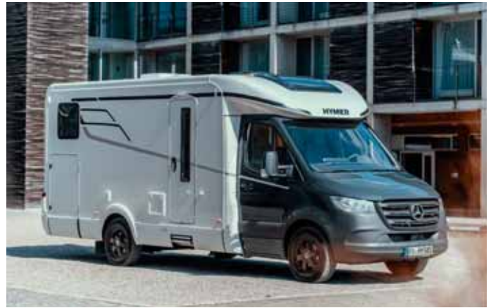
7,09 Meter misst der Neue Hymer Tramp 585 in der Länge. Basisfahrzeug ist der Mercedes Sprinter.

Zudem verfügt auch der neueste Grundriss über die bekannten Vorzüge der Tramp S-Reihe: Das Innere des Fahrzeugs zeichnet sich durch sein modernes, helles Design und das ungewöhnliche Raumgefühl aus. Verstärkt wird diese durch ein Beleuchtungskonzept mit mehreren Lichtebenen. Dank des abgesenkten Chassis-Rahmens ist der Laufboden im gesamten Fahrzeug eben, was in einer Gesamtstehhöhe