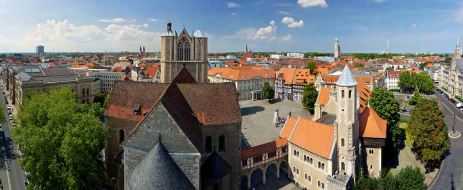
Imposant ist der Blick vom Dom.