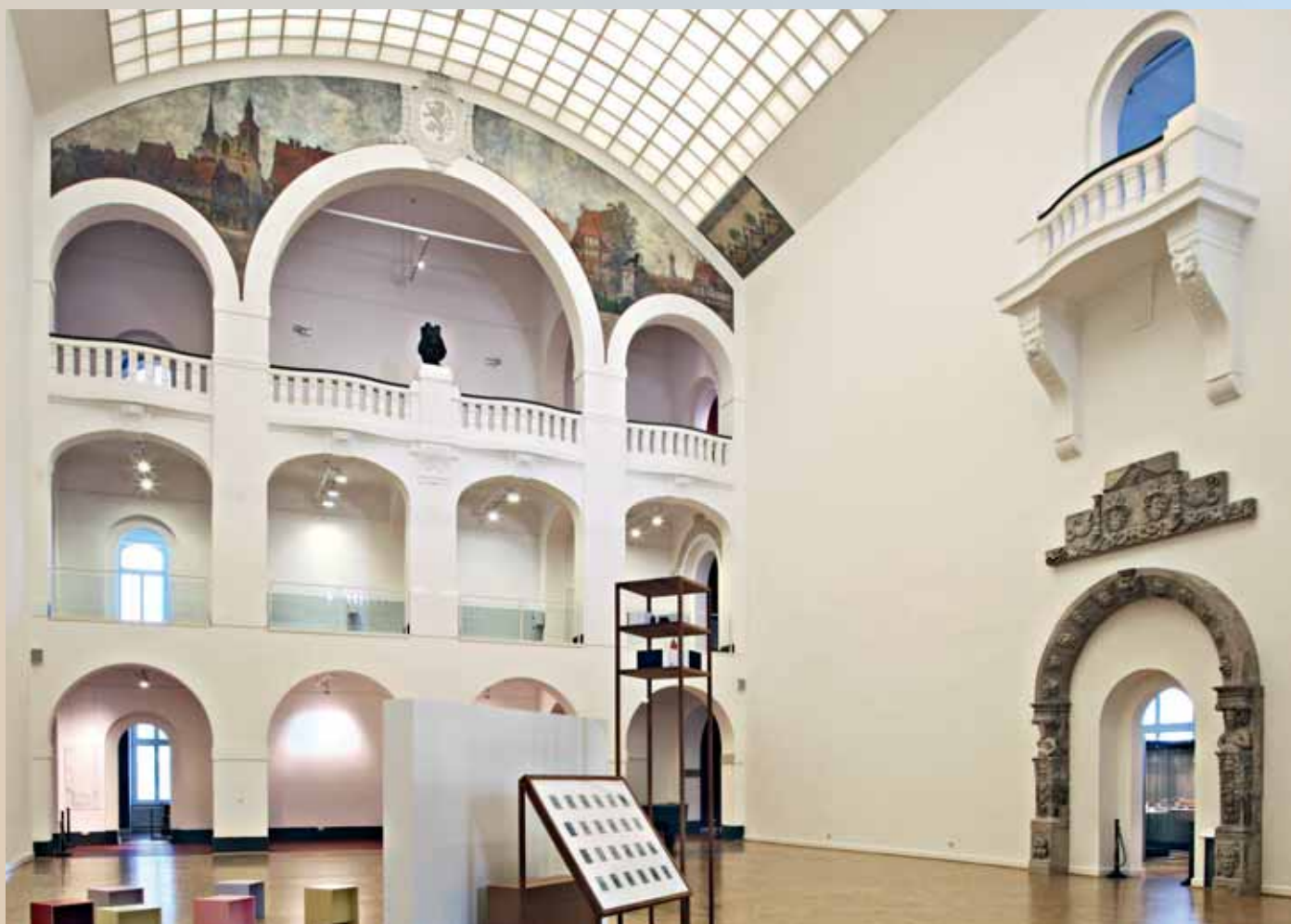
Das städtische Museum ist immer einen Besuch wert.

Als eines der ältesten öffentlich zugänglichen Museen Kontinentaleuropas mit rund 190.000 Kunstwerken aus 3.000 Jahren Kunstgeschichte bereichert das Herzog Anton Ulrich-Museum seit 1754 das Leben von Generationen von Menschen. Ebenso bedeutend ist die umfangreiche Sammlung des Städtischen Museums, das zu den größ-