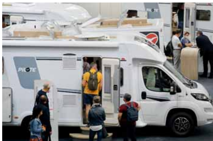
Andrang gab es immer am Pilote-Stand.

Phoenix. Zur Saison 2022 präsentieren sich die Midi- und Maxi-Liner der fränkischen Luxusmobil Manufaktur mit neuem Außendesign. Die Modelle auf Iveco 50C16 und 60C18 Lkw-Chassis übernehmen dabei die moderne Formensprache vom Spitzenmodell Top-Liner, der auf MAN TGL/TGM Chassis aufgebaut wird. Die zwei Grundrisse des Midi-Liners beginnen bei 7,85 Länge und 5,2 Tonnen zulässigem Gesamtgewicht. Die elf Grundrisse der Midi Liner reichen von 7,65 Metern Län-