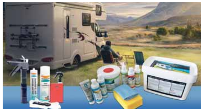
Für Klebe- und Reinigungsarbeiten hält Ruderer ein breites Sortiment bereit.

Wer ein Austrocknen von Kunststoffen verhindern