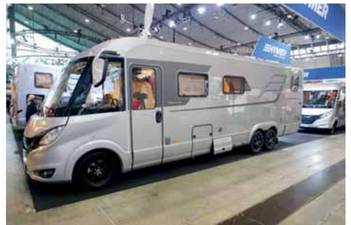
Im Januar 2022 werden Hymer-Reisemobile wieder auf der CMT in den Stuttgarter Messehallen zu sehen sein. Die Unternehmen der Erwin Hymer Group (EHG) beschlossen, in den geraden Jahren sowohl auf der CMT wie auch auf dem Caravan-Salon in Düsseldorf auszustellen.