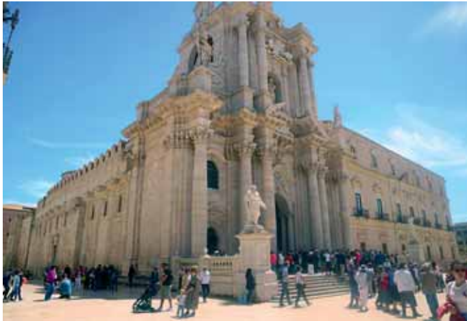
Seit dem 18. Jahrhundert hat der Dom von Syrakus eine barocke Fassade.