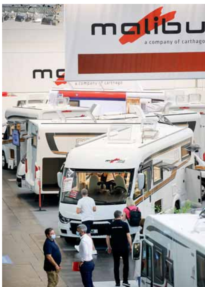
Premieren aus Oberschwaben zeigte Malibu.

ge bei 6 Tonnen Gesamtgewicht bis zu 9,35 Metern Länge bei 7,2 Tonnen Gesamtgewicht – viel Spielraum für luxuriöse Innenräume und gleichermaßen eleganten wie soliden Möbelbau.