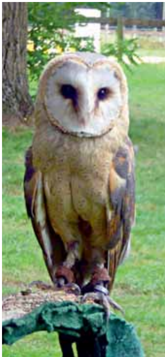
Die Greifvögel in Überherrn beeindruckten.