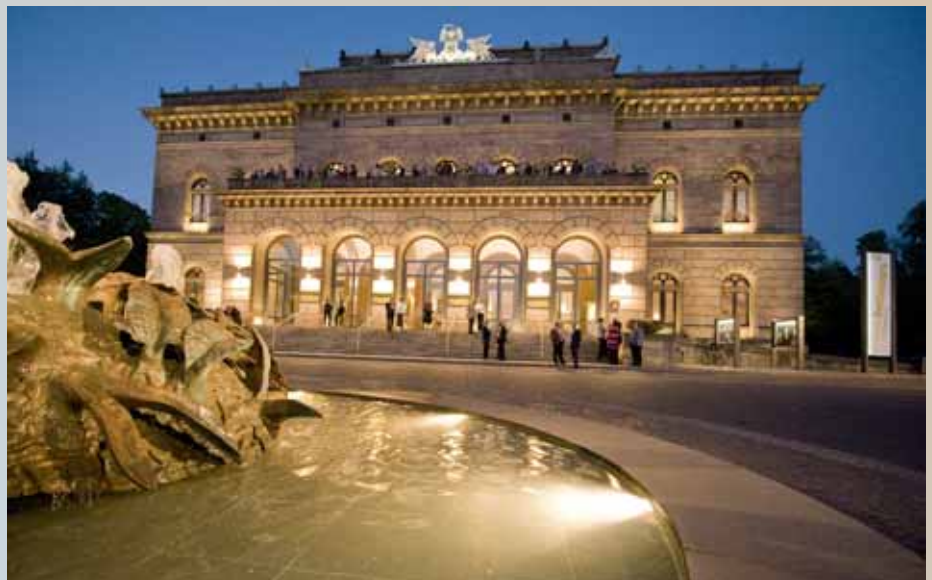
Ein Tempel für die Kultur: das Staatstheater.