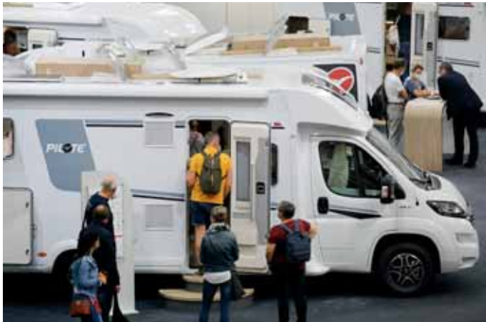
Andrang gab es immer am Pilote-Stand.