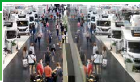
Viele Premieren und 185.000 Besucher beim Caravan-Salon