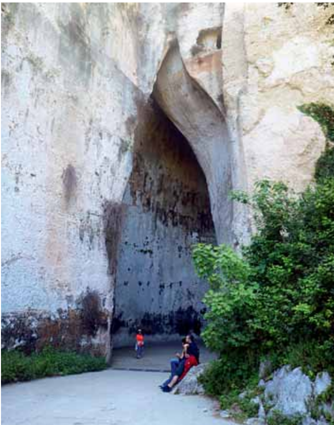
Das Ohr des Dionysos ist die wohl spektakulärste Höhle in Syrakus. Sie wartet mit ungewöhnlicher Akustik auf.

Dazu zählt die eine ungewöhnliche Süßwasserquelle, der Brunnen Fonte Aretusa. Er liegt nur wenige Meter vom Meer entfernt. Das Wasserbecken ist mit Steinen eingefasst und von Papyrusstauden umrahmt. Nördlich des Brunnens befindet sich die Strandpromenade, der Foro Vittorio Emanuele II. Der Sage nach verwandelte sich die griechische Nymphe Arethusa mit Hilfe der Göttin Artemis in eine Quelle, um sich den Nachstellungen eines Jägers zu entziehen, und entsprang auf Ortigia. Der Jäger Alpheios verwandelte sich daraufhin in einen Fluss und erreichte, ohne sich mit dem Meer zu vermischen, die Insel Ortigia, um sich mit Arethusa zu vereinen.