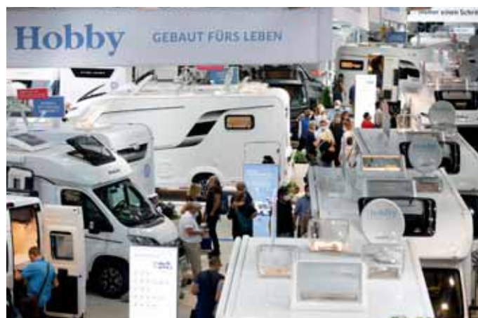
Hobby-Mobile glänzen mit Vollausrüstung.

Sonderstellung in der Phalanx der Einzelbettenmodelle nehmen die 730er EF-Grundrisse ein, die ebenfalls neu in den Baureihen Profila T und RS sowie Integra Line zu finden sind. Die niedrig positionierten Betten prägen diese Fahrzeuge ebenso wie das quer über die gesamte Fahrzeugbreite verlaufende