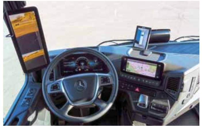
Ein Monitor im Fahrzeuginnen des Vario Alkoven 1050 ersetzt den klassischen Rückspiegel.

Mit mehreren Neuheiten geht die Bohmter Edel-Reisemobilschmiede Vario in die Saison 2022. Absolutes Highlight ist zweifelsohne der Vario Perfect 1200 Platinum auf MB Actros 2553 LLL. Der Dreiachser hat drei Erker, ist 12 Meter lang und bewegt bis zu 26 Tonnen mit einem 530-PS-Motor.