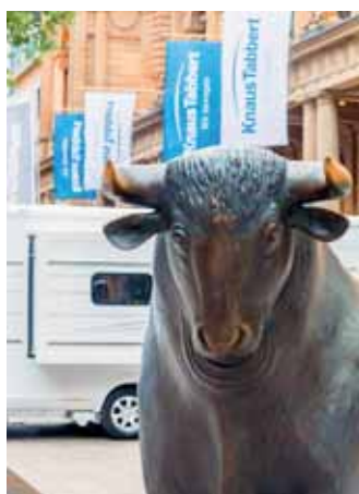
Knaus: Erfolgreich an der Börse S. 15