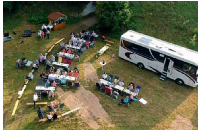
Der Blick aus der Drohnenkamera zeigt, wie beim EMHC gefeiert wurde.

hen, also anzeigen, muss. Solche Hunde werden auf dem Linslerhof auch ausgebildet. Es war für die Teilnehmer des Mobiltreffens faszinierend, in die Welt der Greifvögel eingeführt zu werden.