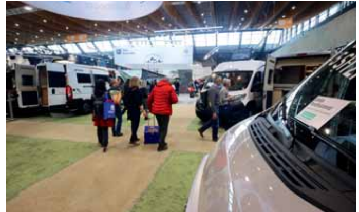
Soll es ein neues Reisemobil sein? Auf der CMT in Stuttgart hat man die Qual der Wahl.