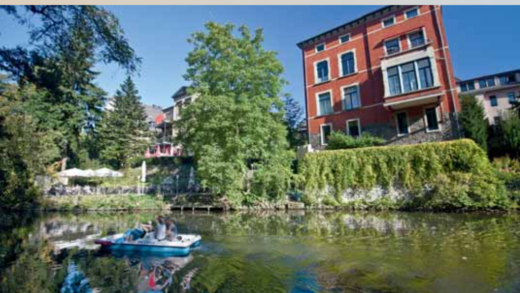
Auch das geht in Braunschweig: Tretbootfahren auf der Oker.