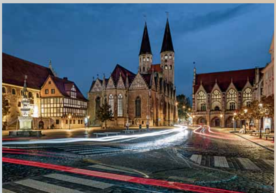
Traumhaft schön bei Nacht: der Altstadtmarkt.