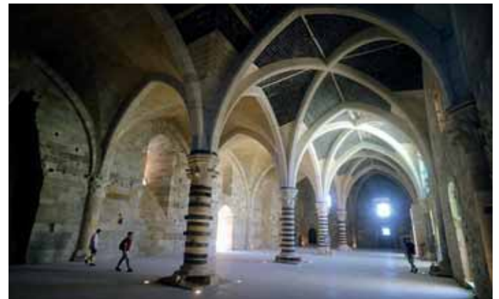
Faszinierend ist der große gotische Saal im Castello Maniace.

Der Palazzo Bellomo beherbergt das größte Museum der Altstadt, das Museo Regionale. Auf der Piazza Duomo stehen der Palazzo Vermexio aus dem 17. Jahrhundert, in dem sich das Rathaus der Stadt befindet, und der Palazzo Beneventano del Bosco. Der ursprünglich mittelalterliche Bau ging 1778 in den Besitz der Familie Beneventano über und wurde