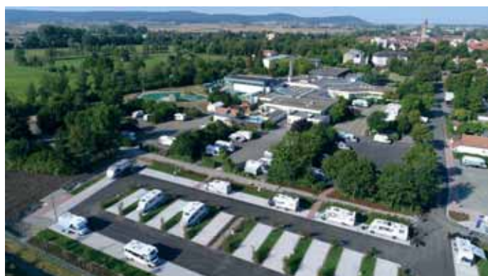
Kurze Wege: Der Wohnmobilstellplatz liegt direkt neben der Frankenthalertherme in Bad Königshofen.

Veranstalter Gerlinde und Dieter Steinacker um schnellstmögliche Anmeldung. Die Teilnahmegebühr am Nikolaustreffen beträgt 147 Euro pro Person. Die Zahlung soll auf dieses Konto erfolgen: Dieter Steinacker, Sparkasse Fulda, IBAN DE86 5305 0180 0070 4070 80. Kontakt: Telefon 066 52/ 96 80 25 privat, 066 52/ 96 80 20 geschäftlich, Mobil 0171 507 80 26, E-Mail: dieter.steinacker@googlemail.com.